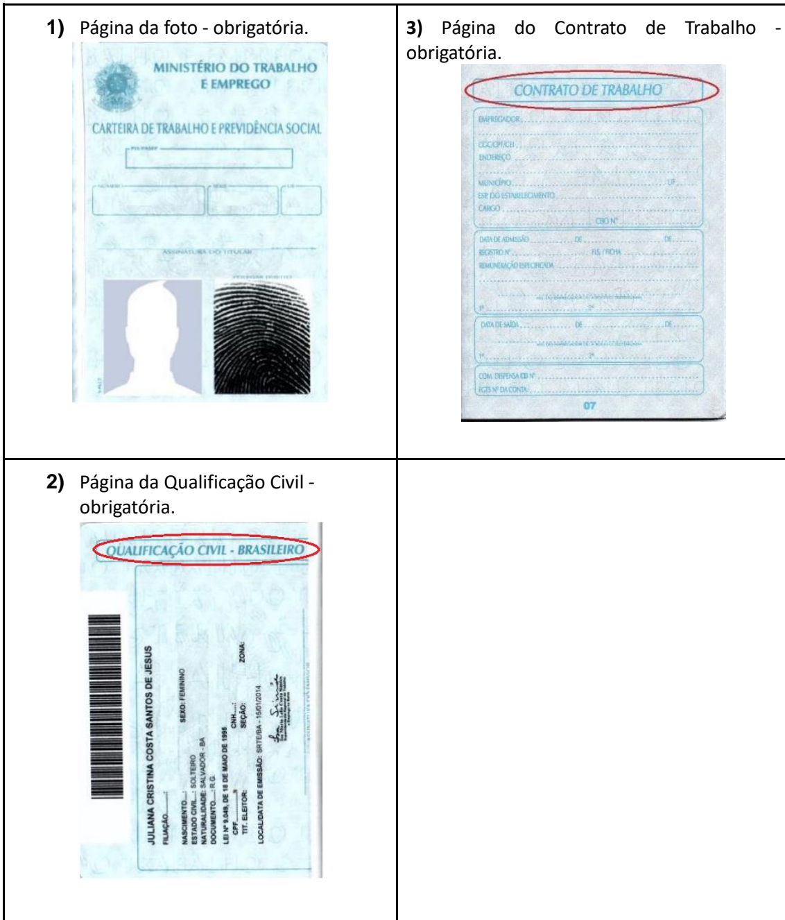
Figura 4: Página de identificação.