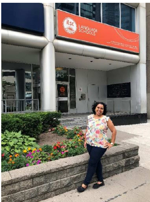
Figura 06: Localização da sede da ILSC Schools of Canada e uma vista geral dos arredores, incluindo a estação de metrô St. Patrick e o cruzamento da University Avenue com a Dundas Street .

A ILSC Schools of Canada tem sede na 443 University Avenue em Toronto (Figura 06) e desde 1991 oferece cursos e treinamentos de idiomas para estudantes de mais de 100 países. O Curso de Imersão em Inglês tem uma abordagem comunicativa e atividades envolvendo as habilidades de ouvir, falar, ler e escrever, exemplificando situações para se comunicar apenas em inglês. As aulas aconteceram das 9h às 14h30min, sendo que das 9h às 12h foi realizado o estudo de todas as habilidades relativas ao Nível Intermediário 1 ( Communication – I1 ) com a professora Homeira Dorghamari (Figura 07) e no segundo turno, das 13h às 14h30min, foi cursada a disciplina eletiva English Through Toronto , ministrada pelo professor Arthur Pearse (Figura 08).