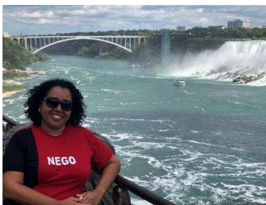
Figura 11: Registro das atividades culturais, na sequência, Niagara Falls , Ripley's Aquarium of Canada , Casa Loma , CN Tower , Toronto Zoo , Ontario Science Centre , Royal Ontario Museum , Toronto Islands , Distillery District , High Park , Chinatown , Bluffer's Park Beach , Trillium Park e Woodbine Beach .

As principais atividades culturais foram promovidas pela agência Toronto First Steps e compreenderam visitas a Niagara Falls , Ripley's Aquarium of Canada , Casa Loma , CN Tower , Toronto Zoo , Ontario Science Centre e ao Royal Ontario Museum . Além desses, foi possível visitar por iniciativa própria os seguintes locais: Toronto Islands , Distillery District , High Park , Chinatown , Bluffer's Park Beach , Trillium Park e Woodbine Beach , conforme registros a seguir (Figura 11).