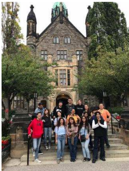
Figura 10: Registro de aulas na disciplina English Through Toronto , durante visita à Universidade de Toronto e à orla do Lago Ontario.

Na disciplina cursada a tarde, English Through Toronto (Figura 10), os estudantes tinham a oportunidade de visitar diversos locais de Toronto, incluindo monumentos históricos, museus, igrejas, bibliotecas, praças, parques e diversos ambientes importantes e significativos para a história da cidade. O professor realizava atividades dinâmicas e procurava discorrer sobre a cultura canadense e a influência de outras culturas presente no desenvolvimento local.