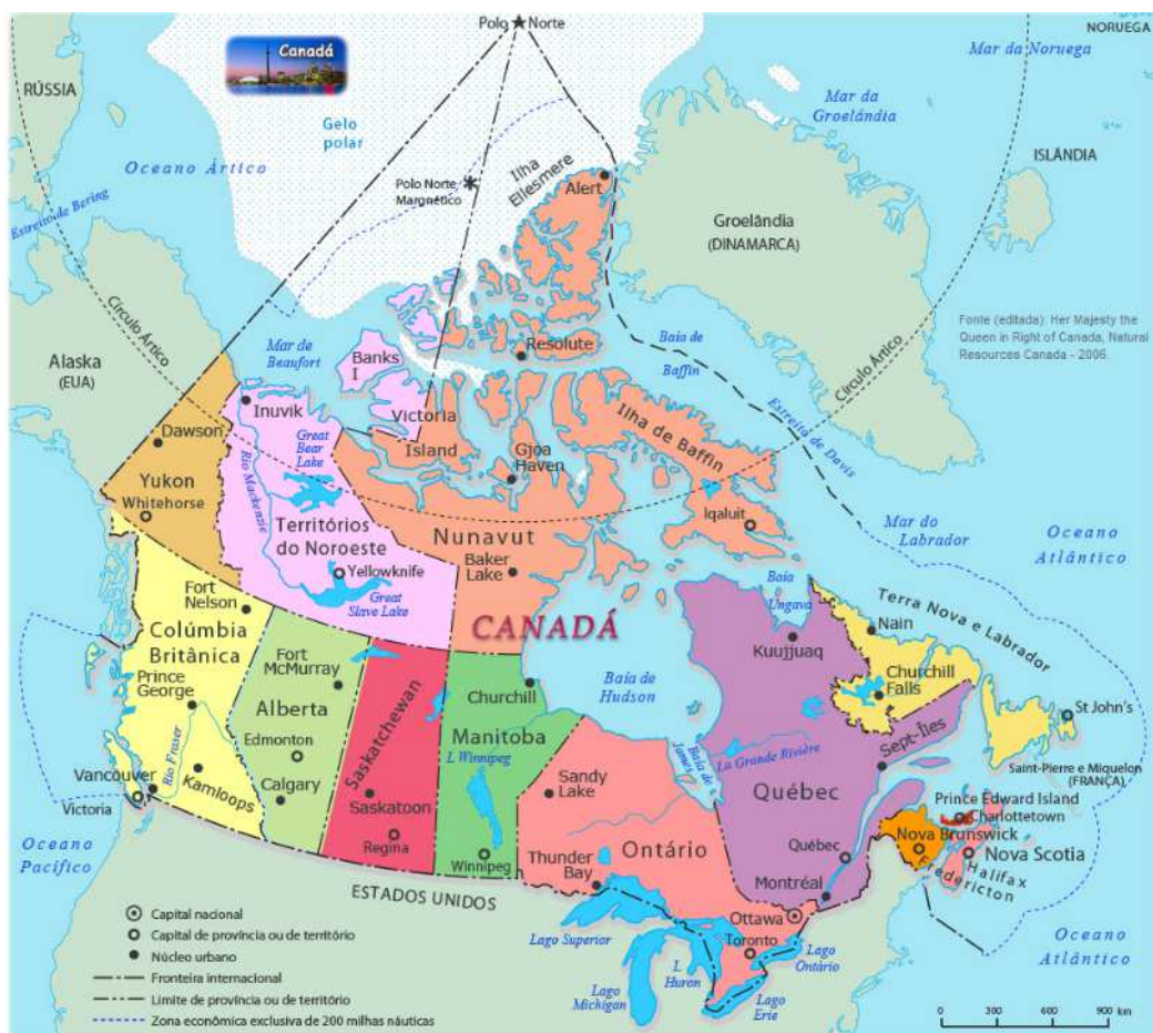
Figura 01 – Mapa ilustrativo do Canadá