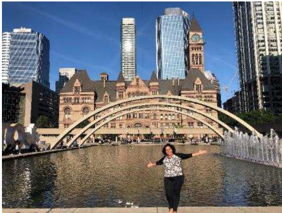
Figura 02: Região central da cidade de Toronto