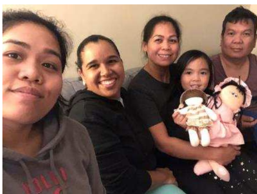
Figura 19: My hostyfamily and my hostsisters

Isso pode ser exemplificado pela característica da família que me acolheu em Toronto (Figura 19), sendo oriunda das Filipinas e que hospeda pessoas do mundo todo. A convivência tranquila com a família foi fator primordial para enriquecer a experiência.