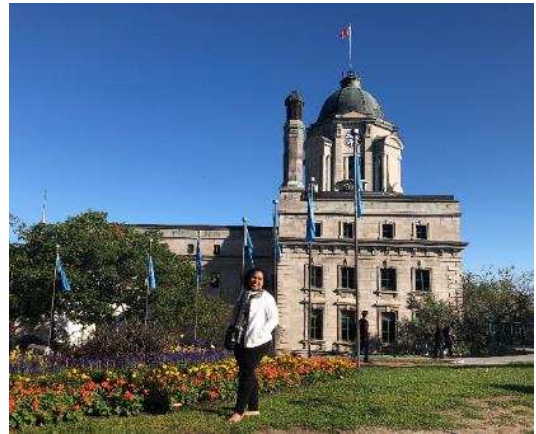
Figura 03: Cidade de Quebec