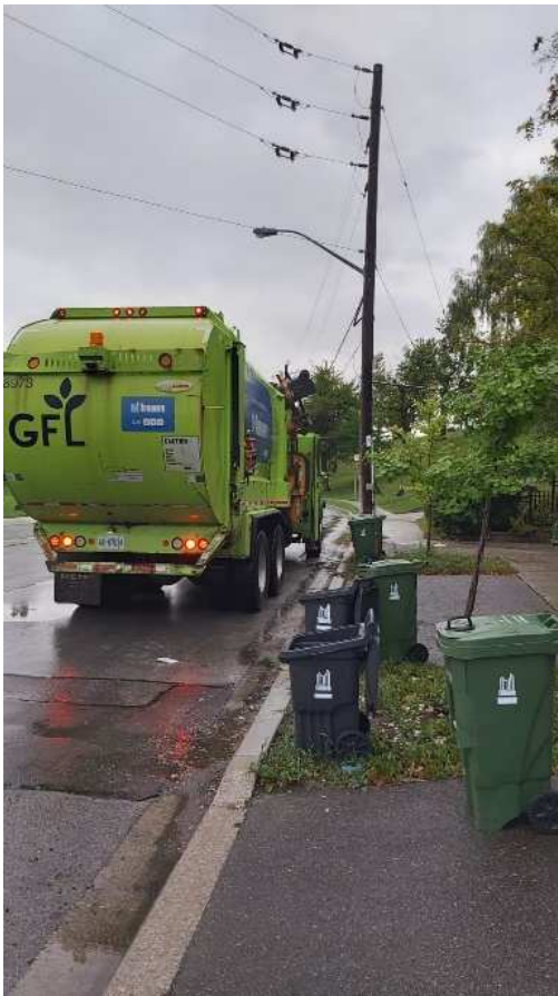
Figura 12: Recolhimento do resíduo orgânico