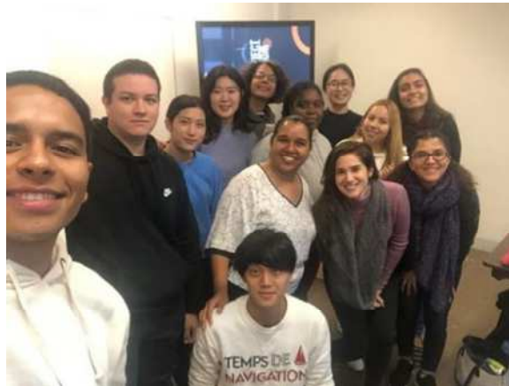
Figura 09: Registro da turma do curso de Inglês ( Communication – I1 )

Na disciplina cursada a tarde, English Through Toronto (Figura 10), os estudantes tinham a oportunidade de visitar diversos locais de Toronto, incluindo monumentos históricos, museus, igrejas, bibliotecas, praças, parques e diversos ambientes importantes e significativos para a história da cidade. O professor realizava atividades dinâmicas e procurava discorrer sobre a cultura canadense e a influência de outras culturas presente no desenvolvimento local.