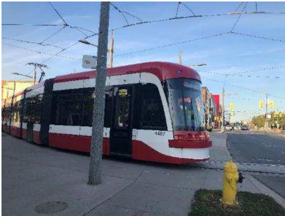
Figura 14: Bondes