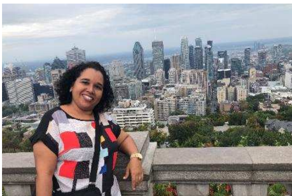
Figura 04: Vista da cidade de Montreal