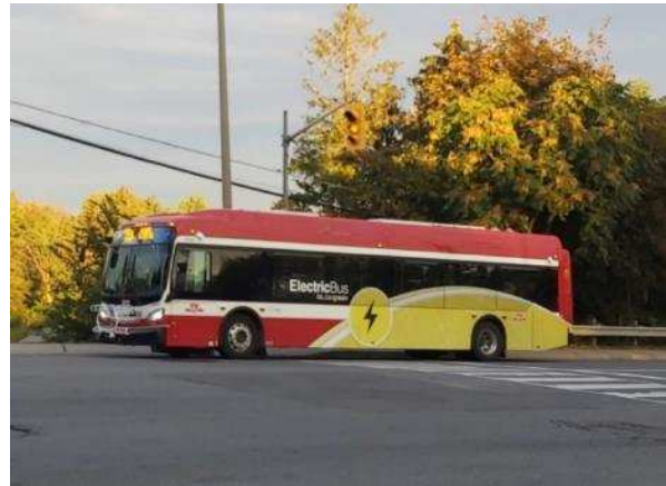
Figura 15: Ônibus elétrico