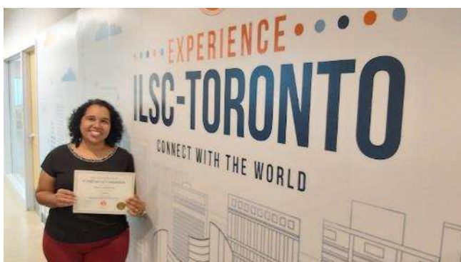
Figura 18: Registro do recebimento do certificado juntamente com os professores do IFPB que participaram do curso no mesmo período.

Os resultados foram bastante positivos (Figura 18), principalmente no aperfeiçoamento da escuta e da pronúncia. Isso se reflete na avaliação final do curso, conforme relatório final e certificado.