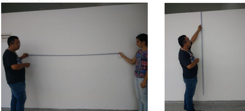
Figura 2: Espaço para publicidade para os candidatos ao cargo de Reitor do IFPB – bloco administrativo

Cada candidato terá um espaço de 1,10 x 2,00 m (largura x altura) no bloco administrativo, conforme a Figura 2: