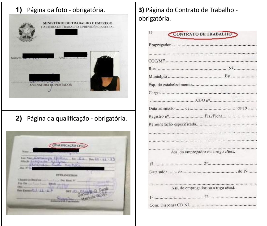
Figura 1: Página de identificação.