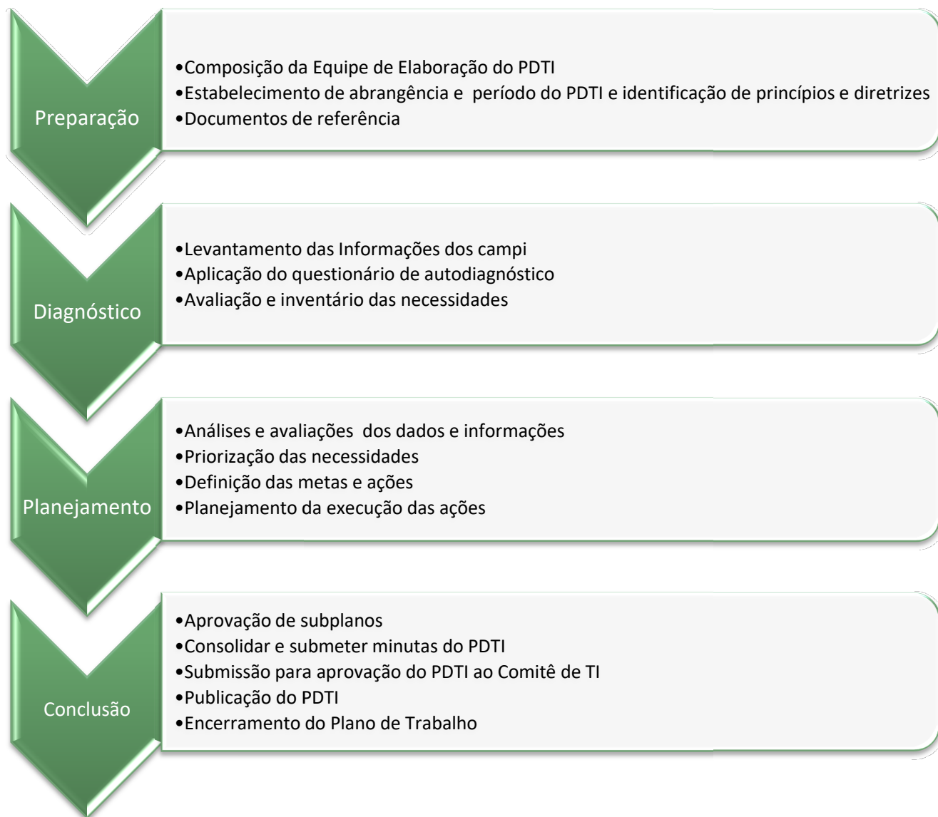
Figura 1 - Processo de elaboração do PDTI

A metodologia aplicada para a construção do PDTI do IFPB foi baseada no Modelo de Referência 2013-2015 e no Guia Prático de Elaboração do PDTI, elaborados pela SLTI. A Figura 1 apresenta o processo de elaboração do Plano Diretor de TI.