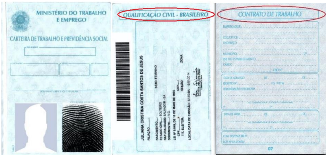
Figura 3: Página de identificação.