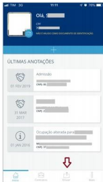
Figura 5: Página da seção de “contrato de trabalho”.