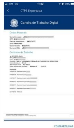
Opção “exportar” para PDF – CTPS digital