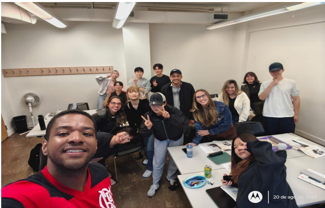
Foto 2: Aula na ILSC Toronto com estudantes de diversas nacionalidades, em vivência marcada pela cooperação, aprendizado e intercâmbio cultural.

A metodologia adotada valorizava a aprendizagem ativa e prática. Participamos de atividades em grupo, em duplas e também de apresentações para toda a turma, o que favoreceu a troca de experiências e a utilização efetiva do idioma. As dinâmicas de conversação nos ajudaram a aprimorar a oralidade em diferentes contextos, desde diálogos cotidianos até discussões mais formais. Além disso, os debates orientados estimularam nosso pensamento crítico e ampliaram nosso vocabulário.