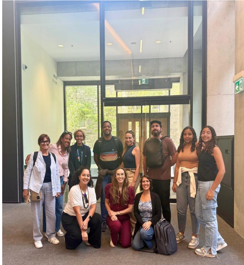
Foto 9: Grupo no campus da University of Toronto - Foto coletiva dos docentes do IFPB em visita guiada ao campus universitário.

acolhimento de estudantes de diversas partes do mundo quanto na construção de parcerias acadêmicas e científicas com instituições estrangeiras. A observação desse modelo permitiu compreender a relevância de fortalecer, no IFPB, políticas institucionais que estimulem a pesquisa aplicada, a cooperação internacional e a formação de redes colaborativas entre estudantes e docentes.