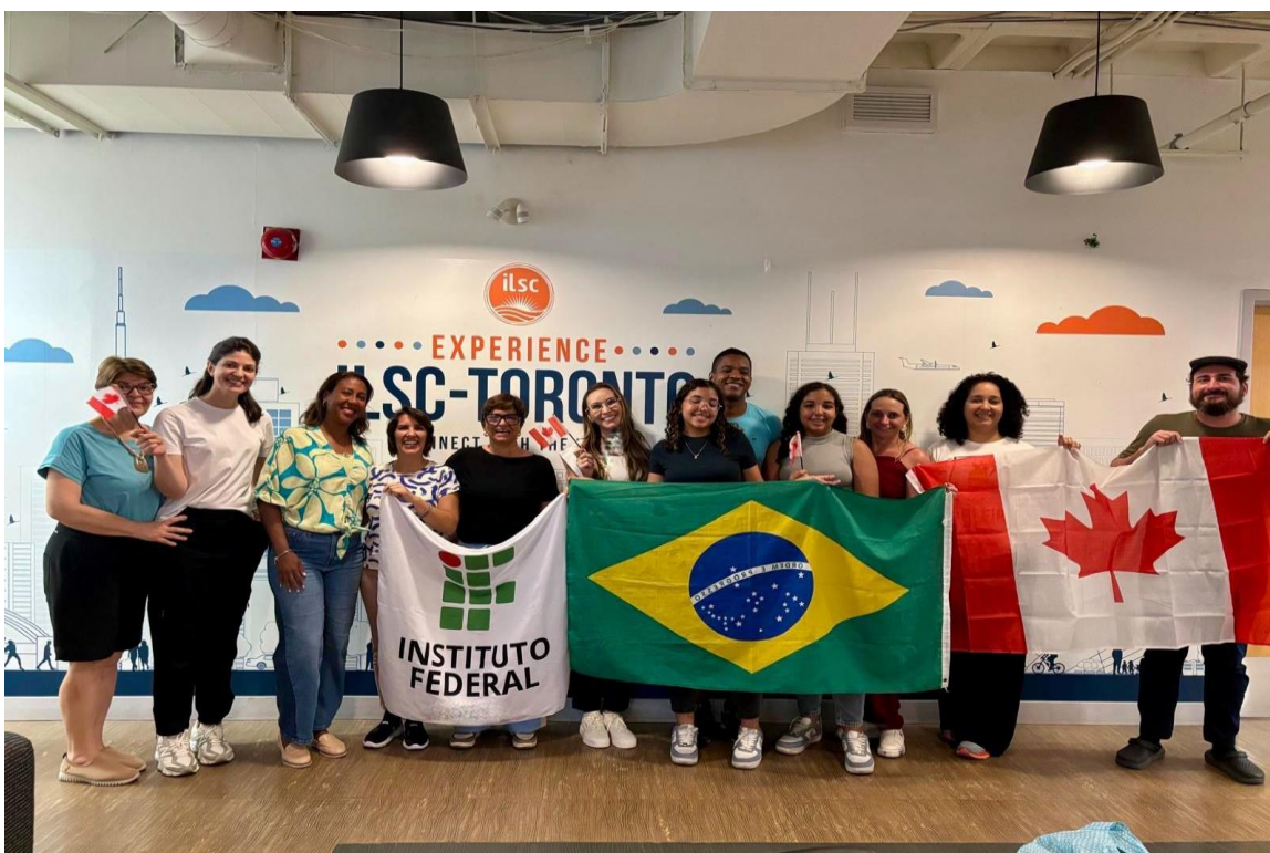
Foto1: Início das atividades na ILSC Toronto: Grupo de docentes do IFPB reunido na sede da ILSC Toronto, em momento de abertura das atividades formativas.

Este relatório tem por finalidade apresentar as atividades desenvolvidas durante o período de intercâmbio realizado em Toronto, Canadá, no âmbito do Curso de Imersão de Língua Inglesa – oferecido pela ILSC Schools of Canada. A experiência buscou aprimorar a proficiência em língua inglesa, ampliar repertórios culturais e acadêmicos, além de fortalecer competências pessoais e profissionais relacionadas à internacionalização do ensino.