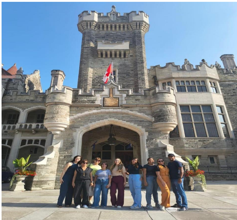
Foto 5: Visita à Casa Loma: Grupo de docentes do IFPB em visita à Casa Loma, marco arquitetônico e cultural da cidade de Toronto.

O Distillery District representou um mergulho na cultura urbana contemporânea. Localizado em uma antiga destilaria restaurada, o espaço reúne galerias, cafés, ateliês e lojas de arte, permitindo observar como Toronto valoriza a preservação histórica integrada à criatividade e ao empreendedorismo. A visita à Toronto Reference Library revelou um exemplo inspirador de biblioteca pública moderna, com design inovador e foco na democratização do acesso à informação e à pesquisa, o que proporcionou reflexões sobre políticas públicas de incentivo à leitura e à educação.