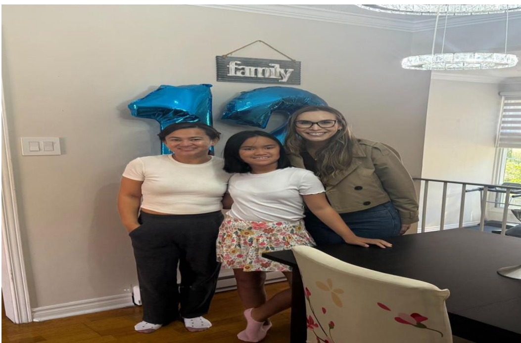
Foto 4: Convivência com a família anfitriã (homestay) – Experiência de imersão cultural e prática espontânea da língua inglesa.

Paralelamente, realizamos visitas a importantes espaços culturais e turísticos de Toronto, que contribuíram de maneira significativa para a ampliação do repertório linguístico e cultural. Entre os locais visitados destacam-se a CN Tower, um dos maiores símbolos da cidade, que oferece uma visão panorâmica de Toronto e reforça o contato com o vocabulário técnico relacionado à arquitetura e ao turismo; o Royal Ontario Museum (ROM), reconhecido internacionalmente por seu acervo de história natural e arte, que proporcionou uma imersão em narrativas históricas e científicas de diversos povos e civilizações; e a Casa Loma, uma construção emblemática que nos transporta à história da aristocracia canadense e à arquitetura neogótica, estimulando o uso da língua inglesa em contextos de mediação cultural.