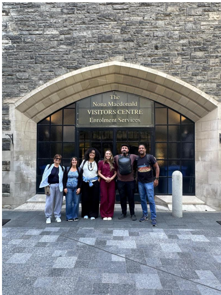
Foto 8: Universidade de Toronto - Visita ao Nona Macdonald Visitors Centre, durante atividade acadêmica na Universidade de Toronto.

Sua infraestrutura é exemplar, com destaque para a Robarts Library, uma das maiores bibliotecas acadêmicas da América do Norte, que combina acervo físico e digital de milhões de volumes com ambientes colaborativos voltados à pesquisa e à aprendizagem autônoma.