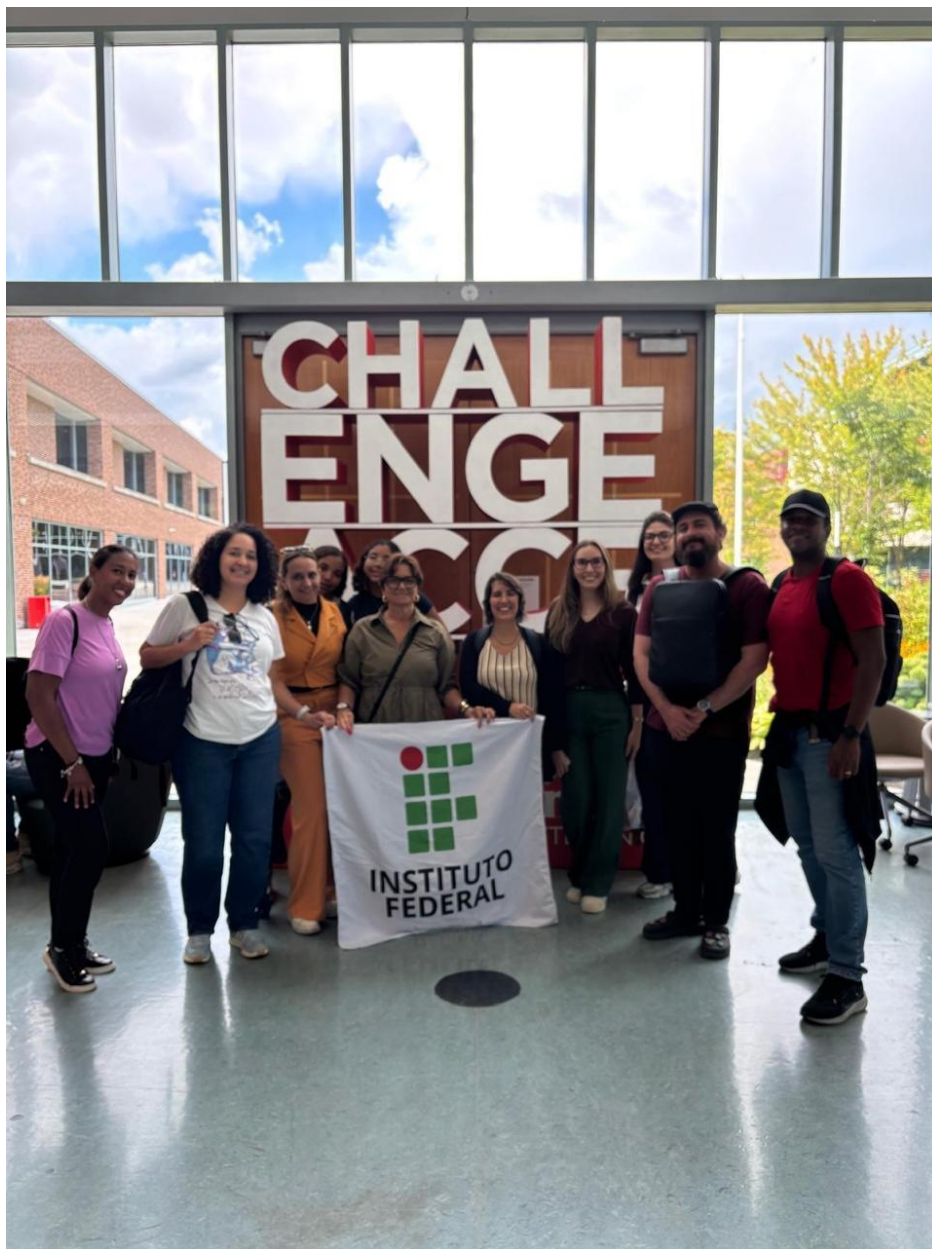
Foto 10: Visita ao Seneca Polytechnic Integração entre teoria, prática e inovação na educação canadense.

uma formação orientada por competências, centrada na resolução de problemas concretos e na construção de soluções criativas e sustentáveis.