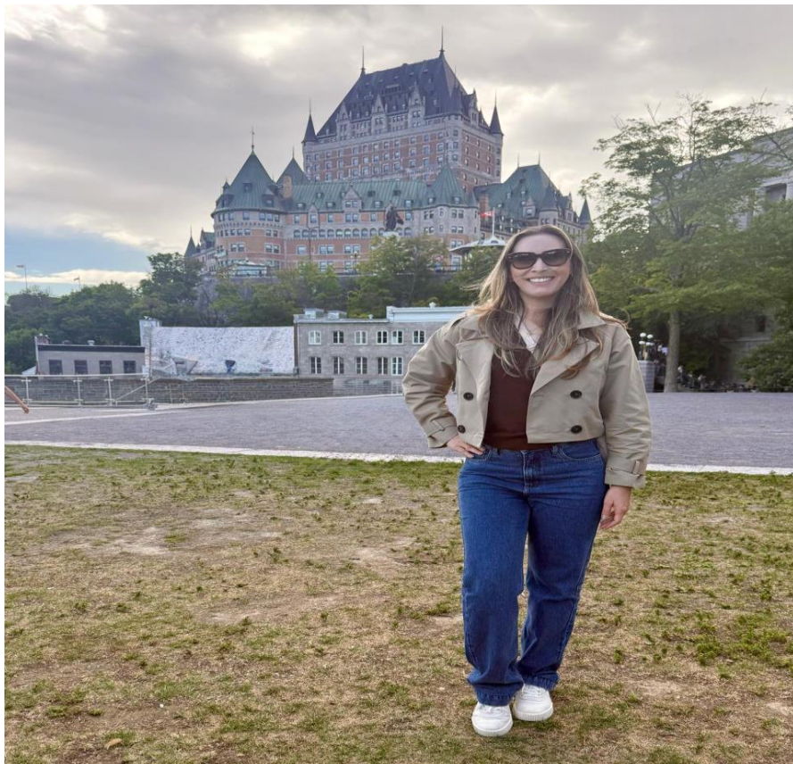
Foto 7: Vivência cultural na cidade de Québec, com visita ao Château Frontenac, um dos marcos históricos mais emblemáticos do Canadá.

Já a viagem à região conhecida como French Canada, que incluiu as cidades de Montreal, Ottawa e Quebec, permitiu compreender a coexistência de duas tradições linguísticas e culturais distintas, uma de língua inglesa e outra de língua francesa, que convivem de forma harmoniosa no Canadá. Essa experiência ampliou nossa percepção sobre a importância da diversidade linguística e da convivência entre diferentes identidades culturais.