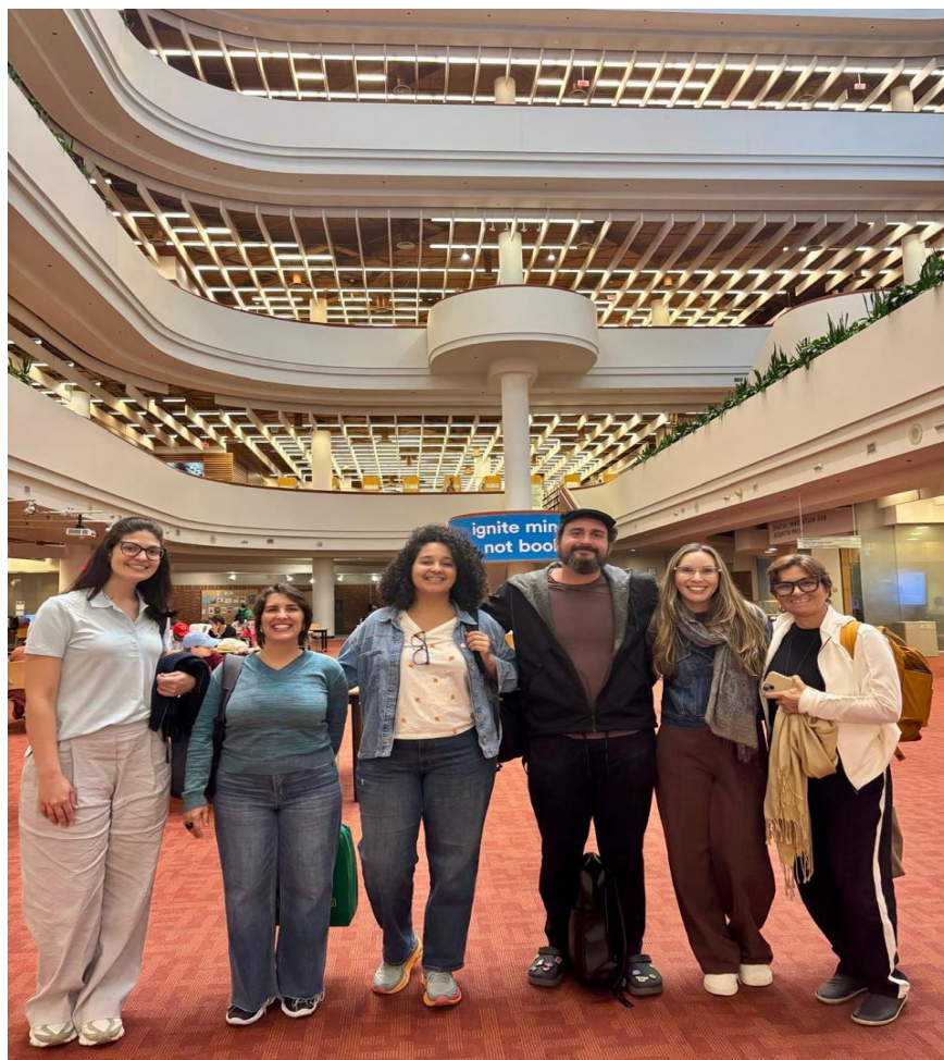
Foto 6; Toronto Reference Library – visão geral: Registro coletivo do grupo de professores do IFPB na Toronto Reference Library.

O Ripley's Aquarium of Canada ampliou o contato com o vocabulário técnico das ciências naturais e ambientais, enquanto a Art Gallery of Ontario (AGO) proporcionou um encontro com a arte canadense e internacional, destacando a valorização da diversidade de expressões e de artistas de diferentes origens. Esses espaços se mostraram verdadeiros laboratórios culturais, onde o aprendizado linguístico se combinou à observação estética e científica.