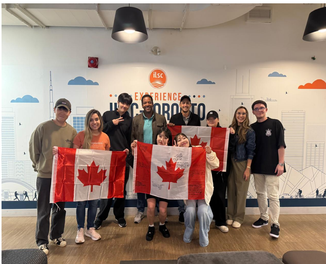
Foto 3: Registro do encerramento na ILSC Toronto com estudantes de diferentes nacionalidades, celebrando o aprendizado e a convivência intercultural.

No campo da leitura, trabalhamos com textos jornalísticos, que serviram de base para discussões em sala e atividades de interpretação. Na escrita, produzimos redações, sempre acompanhados de feedback individualizado dos professores, que nos ajudou a corrigir pontos específicos e a evoluir de forma consistente. Também realizamos provas orais, escritas, de escuta e leitura, o que garantiu um acompanhamento contínuo do nosso progresso em todas as competências linguísticas.