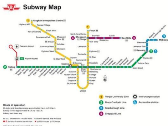
Figura 5 - Mapa do Metrô de Toronto

O metrô de Toronto funciona diariamente de 6am às 1:30am e a partir das 8am aos domingos. No total são 4 linhas de metrô e elas se conectam em alguns pontos.