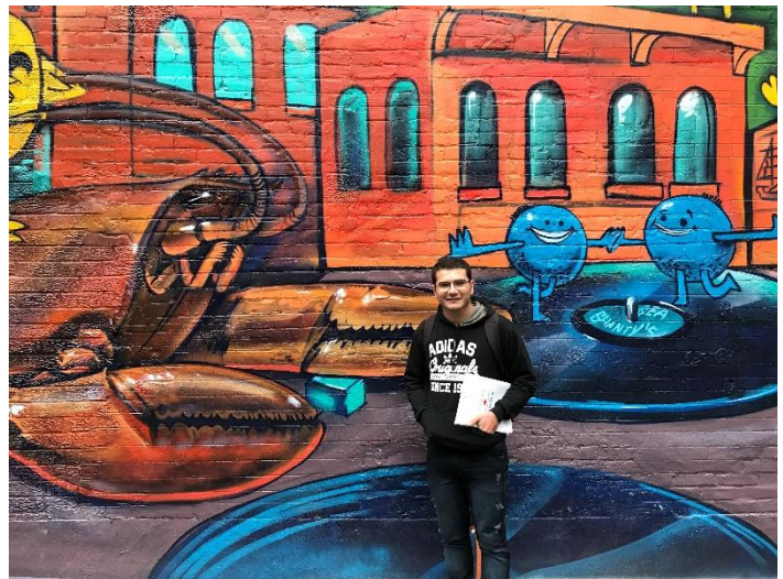
Figura 14 – Graffiti Alley