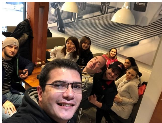
Figura 8 - Turma da Tarde