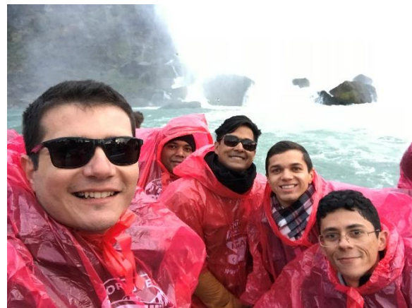
Figura 17 – Niagara Falls