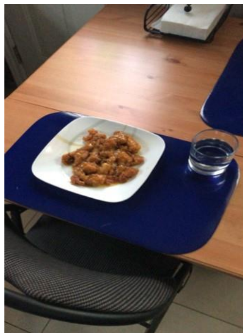
Figura 11 – Alimentação