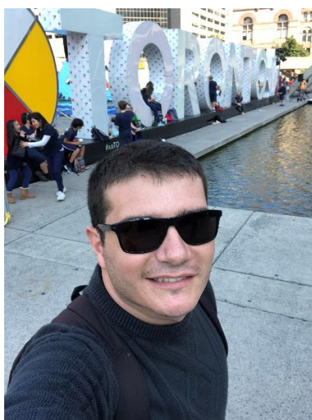
Figura 1 - Praça da Prefeitura de Toronto

Composta por avenidas largas e edifícios altos em que às vezes se misturam entre os estilos clássico e o moderno. Toronto está localizada às margens do Lago Ontário, e é capital da província de mesmo nome, Ontário. A cidade é bastante urbanizada, não é barulhenta, limpa e tem muitas opções de restaurantes, festivais culturais, brechós, lojas de roupas e artigos para casas, mercados, docerias e etc. Se consegue ver na cidade uma mistura de culturas e tolerância às diferenças.