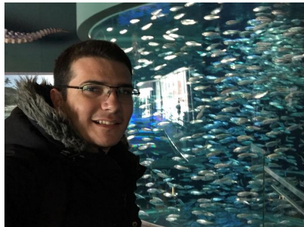
Figura 18 – Ripley's Aquarium