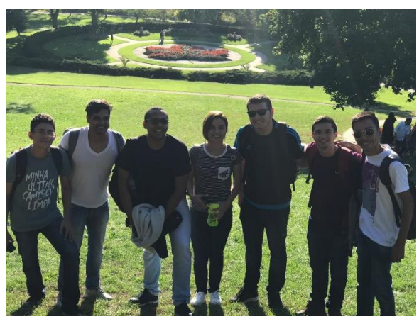
Figura 13 – High Park