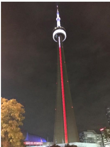
Figura 19 – CN Tower