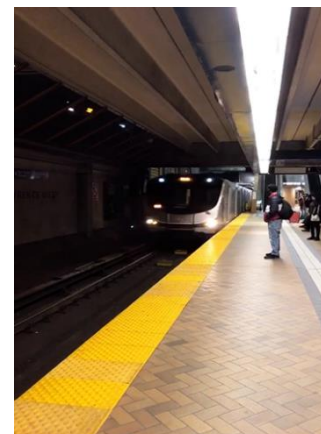
Figura 6 - Metrô de Toronto