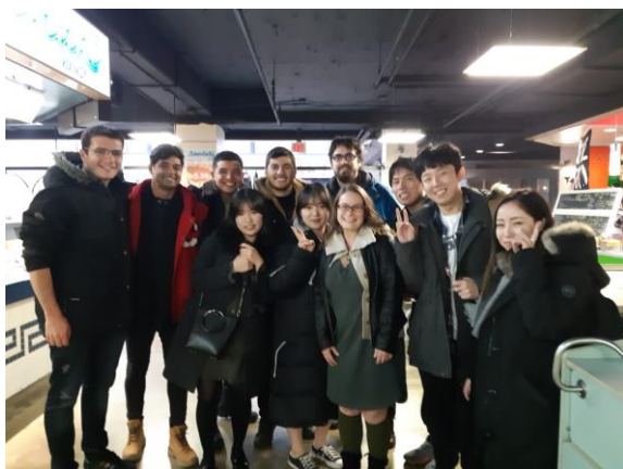
Figura 7 - Turma da Manhã

Fazíamos duas aulas por dia a primeira das 09:00h até as 12:00h, praticávamos todas as habilidades escritas a cima, e a tarde das 13:00h as 14:30h (nova turma), você tem a opção de escolher qual habilidade deseja estudar (gramática, listening, communication), optei por communication.