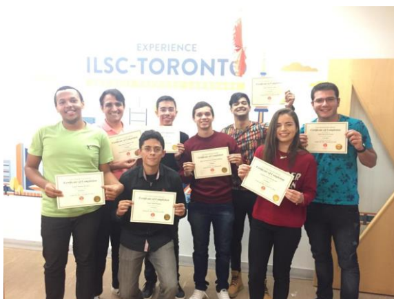
Figura 9 - Certificados