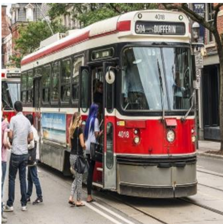
Figura 3 - Streetcar (Modelo Antigo)

O streetcar é o bondinho que anda nos trilhos em algumas ruas da cidade. No momento há dois tipos de bondes, um velho e um novo. Eles estão sendo substituídos aos poucos pois é preciso trocar os trilhos. Os carros antigos são apertados e não possuem ar condicionado nem dispositivo para facilitar a entrada de pessoas com dificuldade de locomoção. Os novos são mais compridos e amplos e ficam praticamente no mesmo nível da calçada.