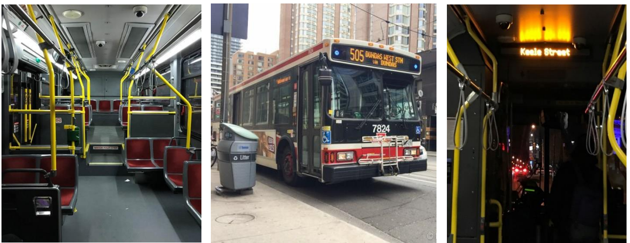
Figura 2 - Ônibus

Todos os ônibus têm ar condicionado, dispositivo para rebaixar a parte da frente facilitando a entrada de pessoas com dificuldade de locomoção, carrinhos de bebê e cadeirantes. Na parte da frente ainda tem um lugar para levar bicicletas. Nós geralmente embarcamos pela porta da frente, exceto em algumas rotas, onde é permitido embarcar em qualquer porta. Espere as pessoas descerem para entrar. O desembarque pode ser feito em qualquer porta. Ah e não é preciso fazer sinal para o ônibus ou streetcar parar, se tiver gente no ponto eles param.