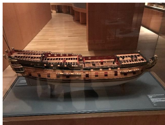
Figura 16 – Art Gallery