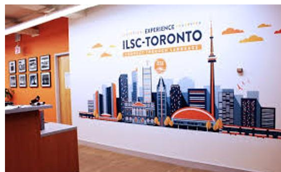
Figura 10 – Andar administrativo da escola