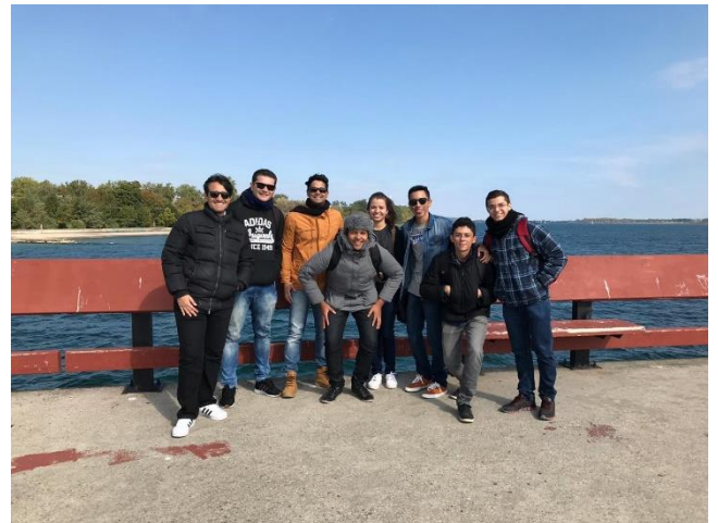
Figura 15 – Toronto Island