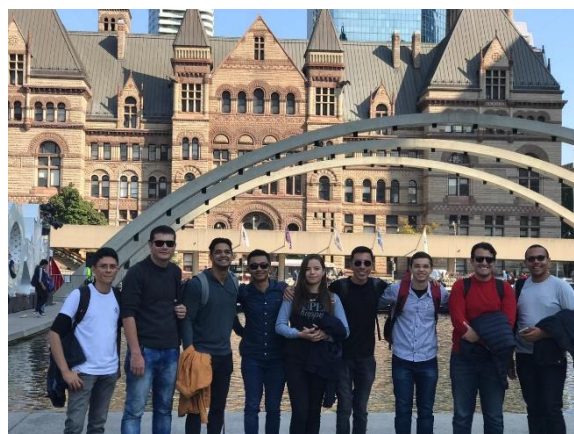
Figura 12 – Praça da prefeitura