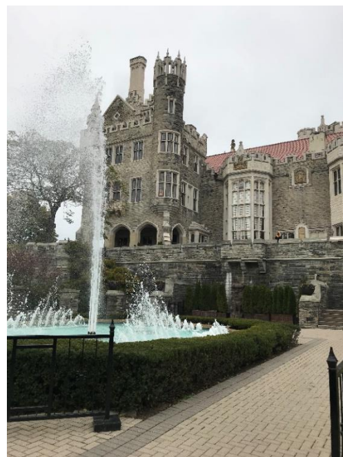
Figura 20 – Casa Loma