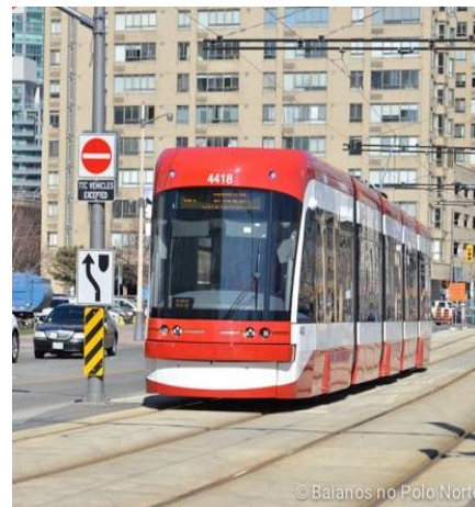
Figura 4 - Streetcar (Modelo Novo)