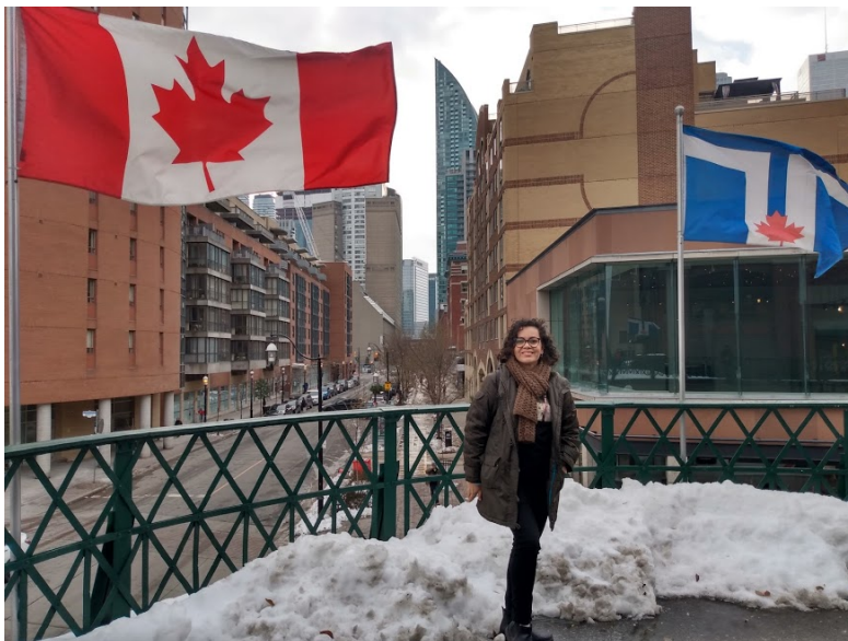
Saint Lawrence Market