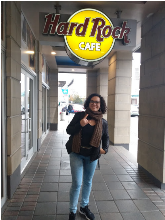
Hard Rock Cafe, Niagara Falls