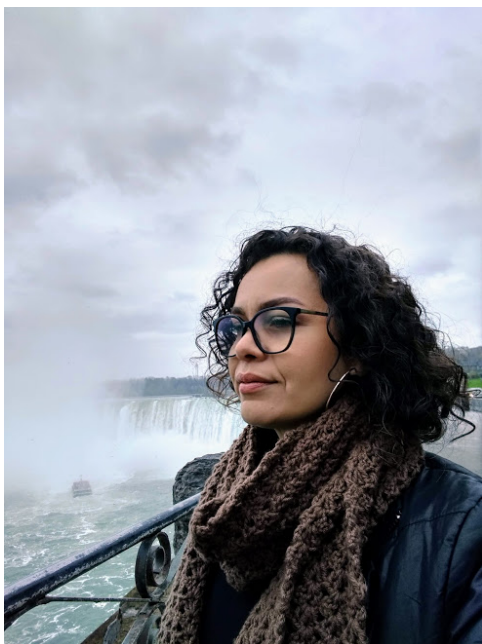
Em Niagara Falls