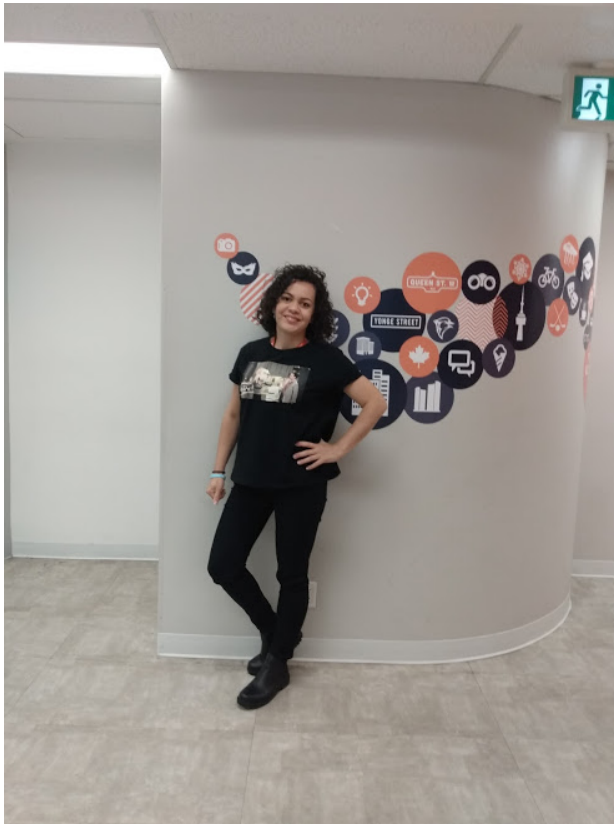
Início das aulas