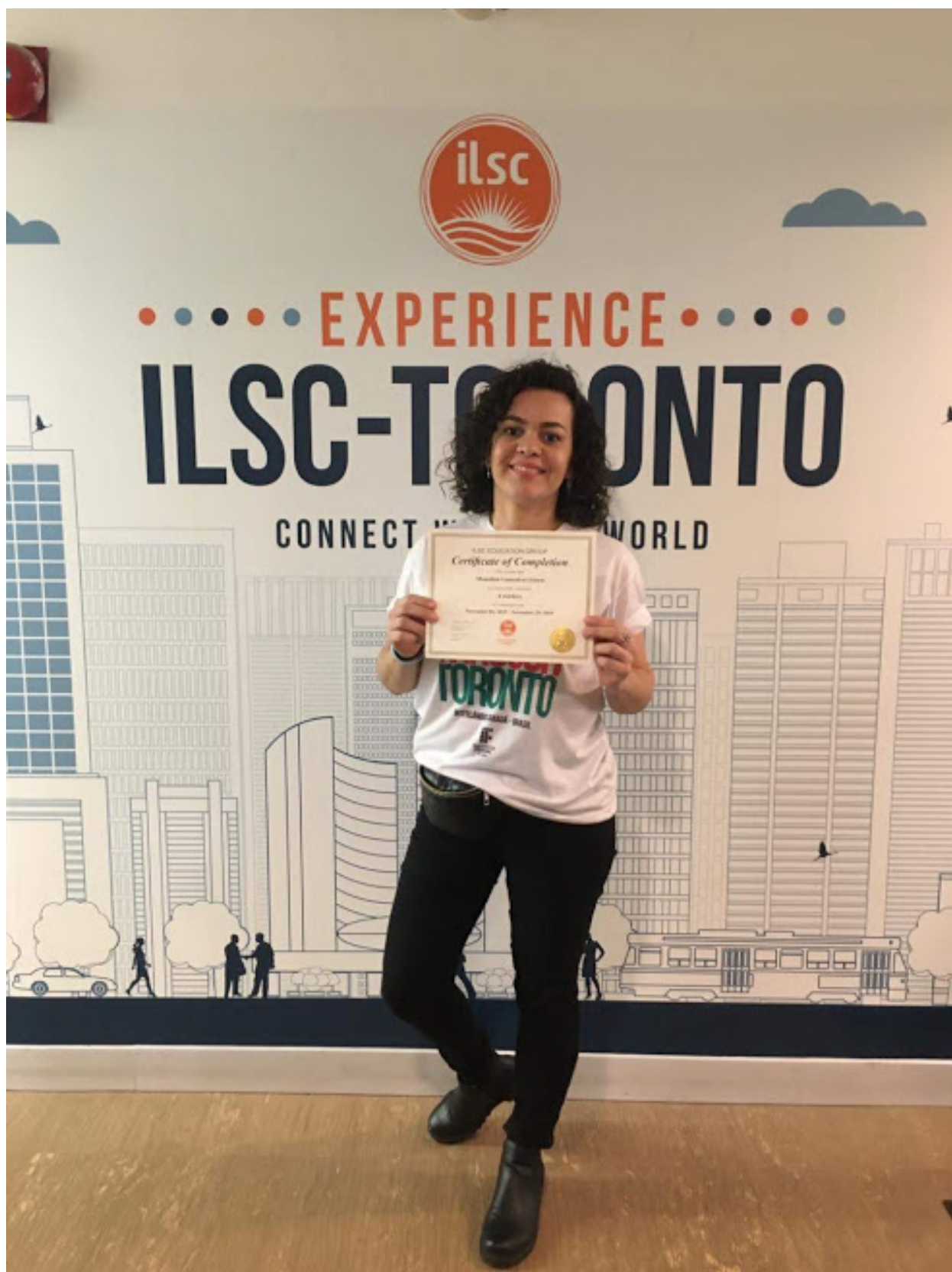
Conclusão do curso com objetivo alcançado: certificado conquistado com mérito