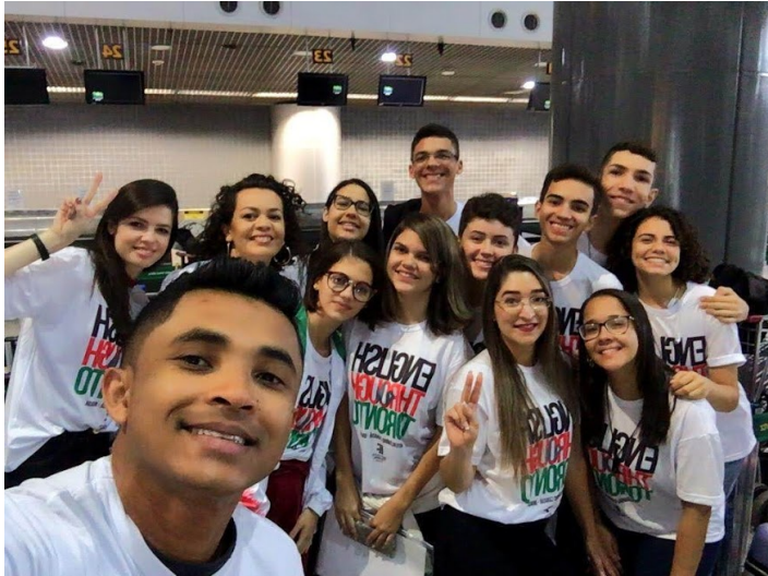
Ainda no Brasil, no aeroporto, antes de embarcarmos