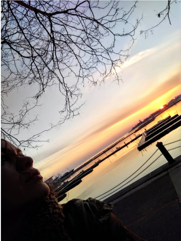
Crepúsculo no Harbourfront