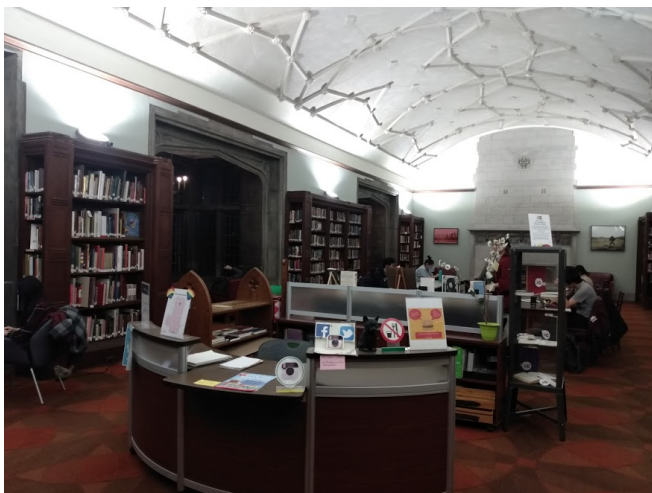
Biblioteca da University of Toronto