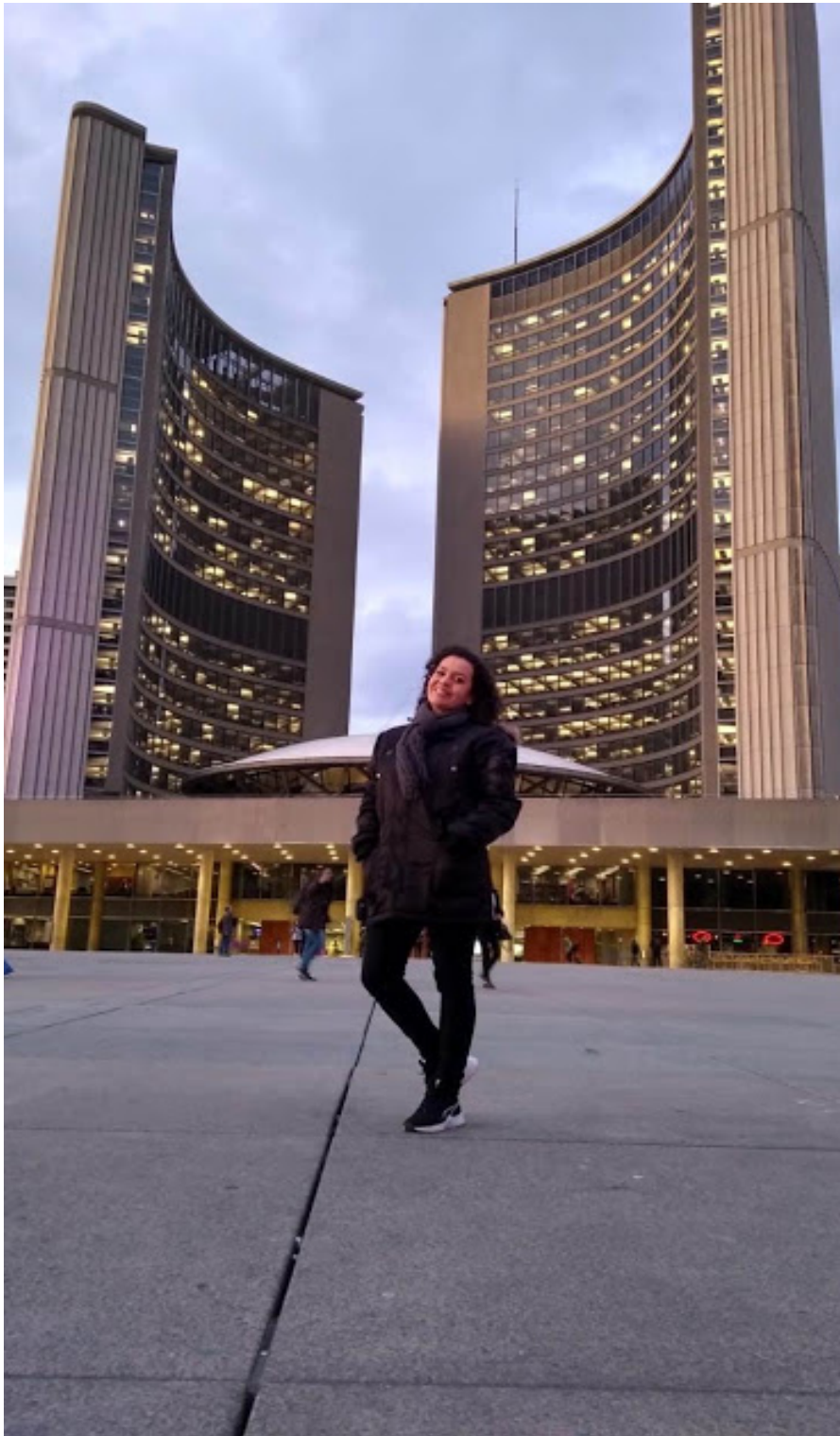
Em frente à prefeitura de Toronto