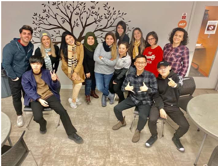
As turmas com as quais estudei na ILSC, diversas origens e culturas