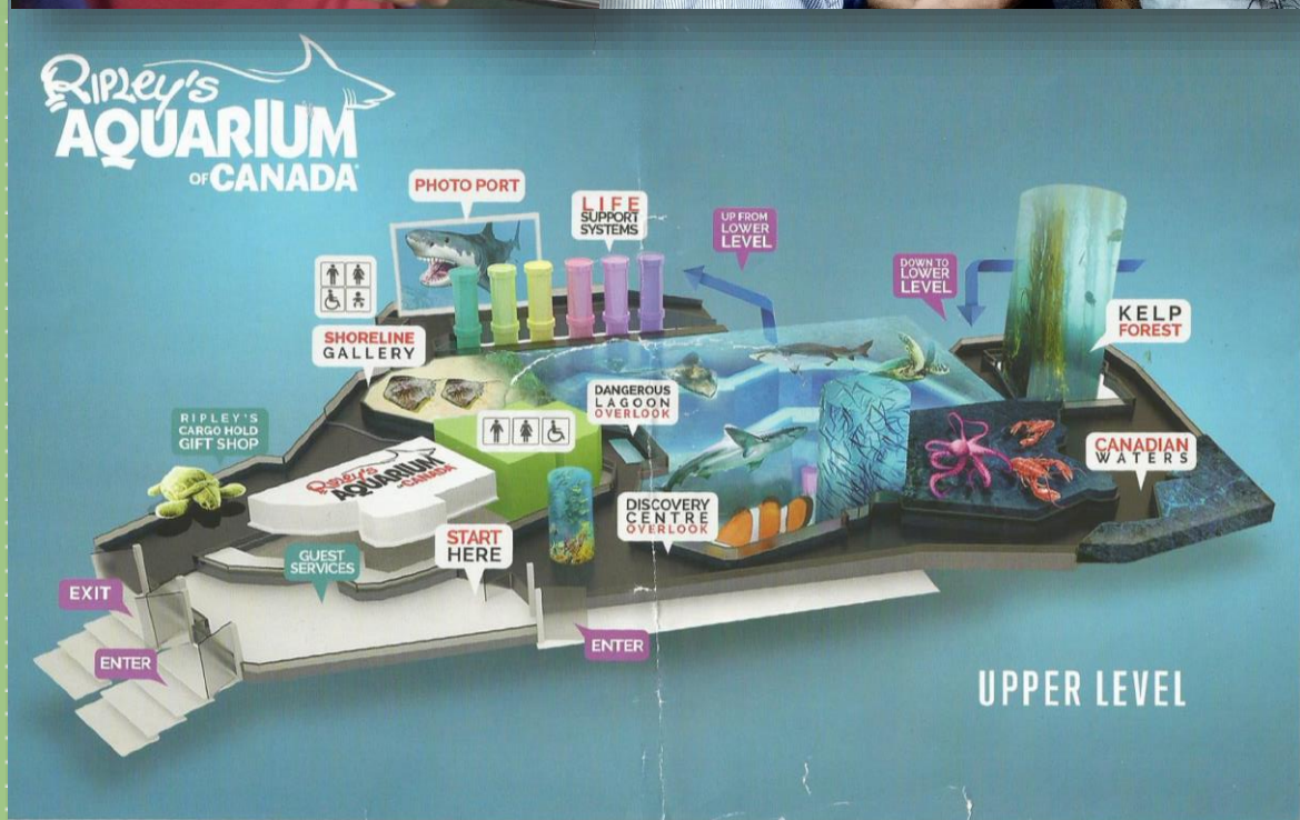
MAPA DO ÁQUARIO