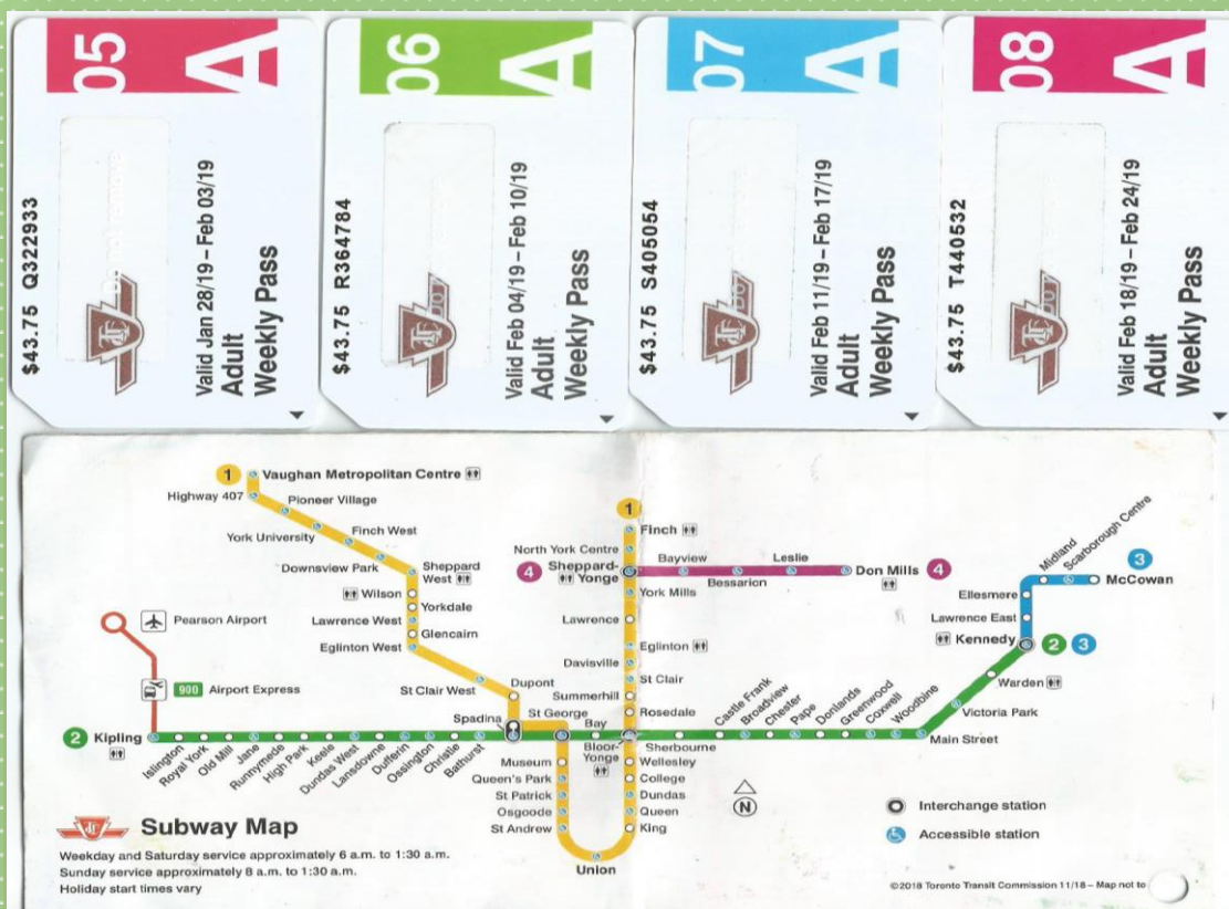
MAPA DO METRO E PASSES SEMANAIS

O CLIMA RIGOROSO DO INVERNO FOI O MAIOR DESAFIO NA MINHA OPINIÃO QUE APESAR DE DIFICULTAR MUITO O DESLOCAMENTO, NÃO TIROU A MAGIA E O BRILHO DA CIDADE. A CIDADE CONTA UMA VARIEDADE ENORME DE PONTOS TURÍSTICO E ATIVIDADE INTERESSANTES PRA SE DESFRUTAR.