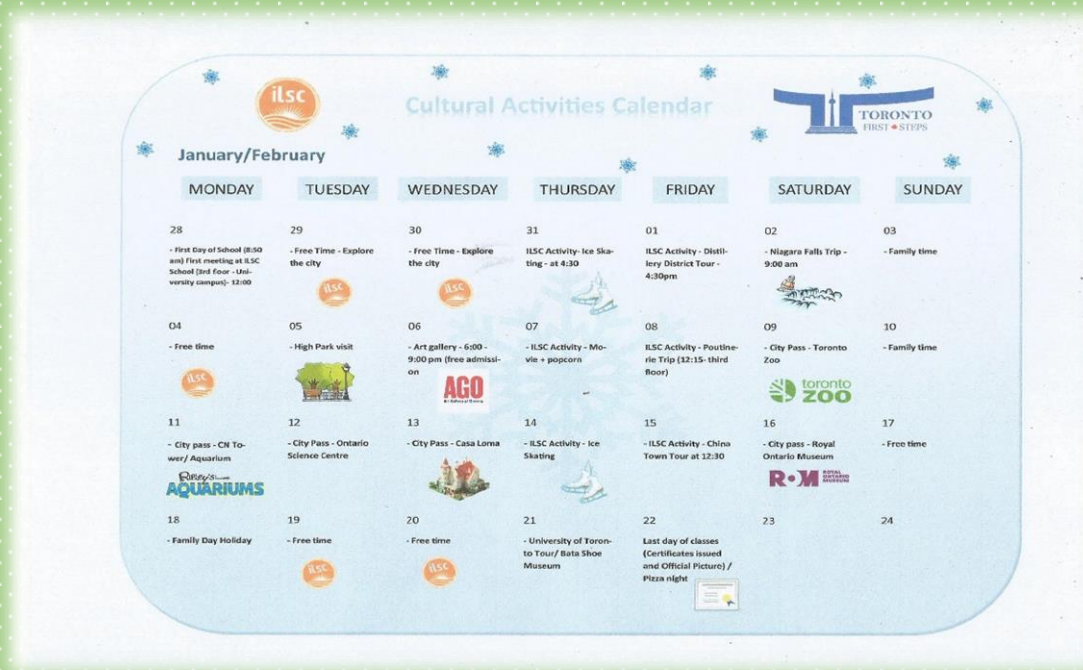
Calendário das atividades escolares

NA SEGUNDA FEIRA DIA 28 TIVEMOS NOSSO PRIMEIRO DIA DE AULA MAS ANTES PASSAMOS PELO TESTE DE NIVELAMENTO ONDE DEFINIRAM NOSSO NÍVEL DE INGLÊS E NOS ENVIARAM PRA SALAS CORRESPONDENTES.