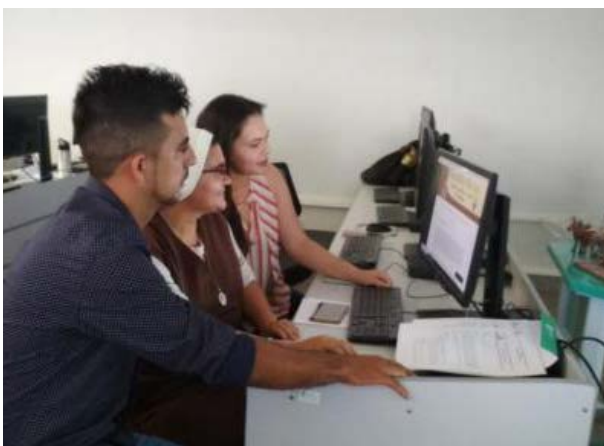
Foto 3 - Treinamento para manutenção de site para equipe do Educandário São José