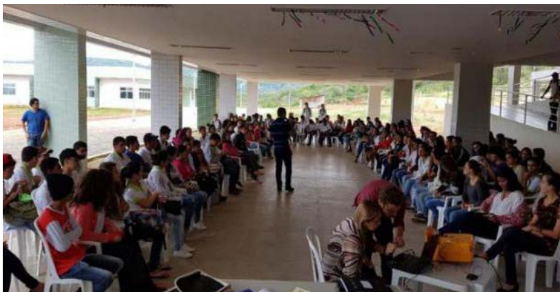
Foto 10 - Palestras educativas para enfrentamento à violência sexual