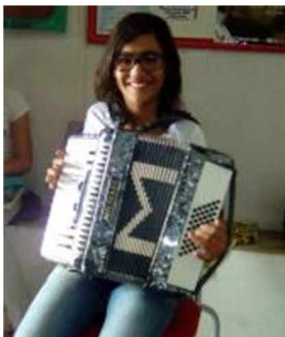
Foto 3 - Oficina de Sanfona na Lagoa de São João