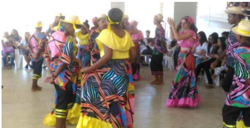
Foto 18 - Grupos culturais quilombolas para apresentação no IFPB

Dia da Consciência Negra (2016 - 2019) - Cultura para combater o racismo estrutural e institucional.