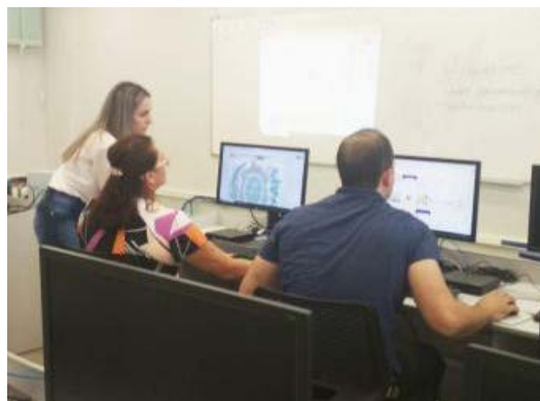
Foto 4 - Treinamento para manutenção de site para gestores da Pousada Cajá