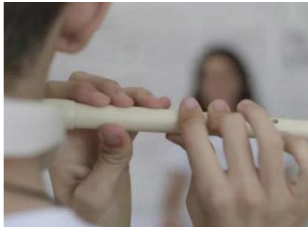
Fotos 6 e 7 - Gravações das aulas de educação musical (escaleta e pífano)