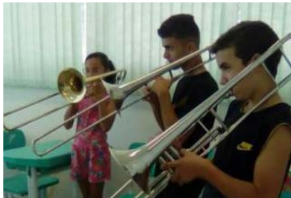
Foto 2 - Oficina de Instrumentos de Sopro Lagoa de São João e EEEFN Gama e Melo, IFPB - Princesa Isabel