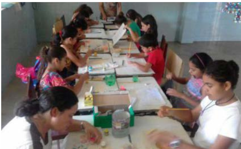
Foto 2 - Oficinas de trabalhos manuais