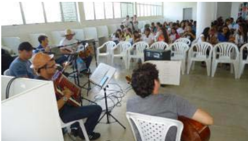
Foto 5 - Apresentação musical, participantes do Neccom e do grupo Dó-sentes