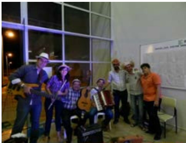
Foto 1 - Dó-sentes executando trilha sonora no Auto de Natal Nordestino em 2015

O grupo proporciona aos envolvidos possibilidades de desenvolvimento de habilidades e capacidades através da música, tanto artísticas como de criticidade, uma vez que a escolha do repertório atende a temas desde culturais a questões de direitos humanos. E para colaborar com o grupo, músicos da cidade de Princesa Isabel eram convidados para participações especiais nas apresentações dos Dó-sentes.