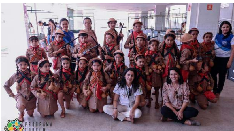
Foto 17 - Grupos culturais para apresentação no IFPB