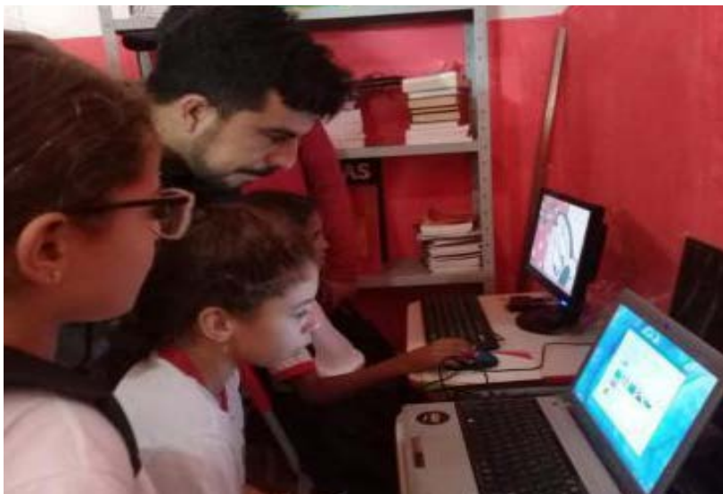
Foto 1 - Oficinas de Inclusão Digital