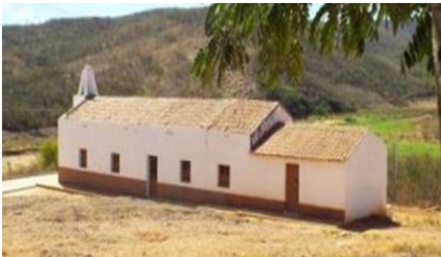
Foto 1- Visita à sede da Associação da Comunidade Entre Montes