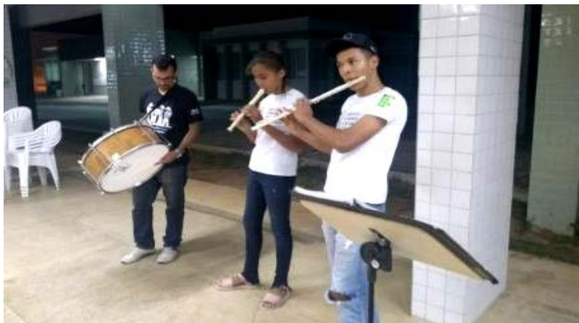
Foto 15 - Apresentação musical do Grupo Forró para Todos

Semana da Biologia (2019) - Evento para discussão de metodologias de ensino pesquisa em Biologia.