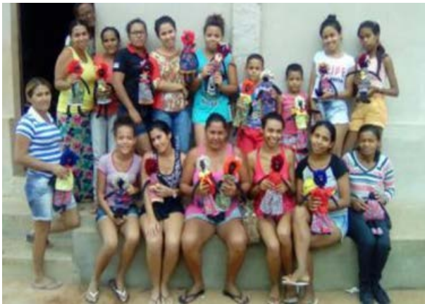
Foto 3 - Oficina de Confecção de Bonecas