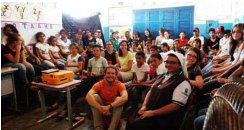
Foto 3 - Exibição de filme na EMEFPMS, na comunidade Cabeça do Porco, em Princesa Isabel -PB