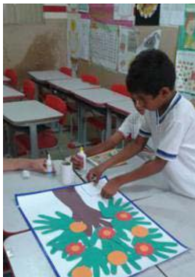
Foto 2 - Crianças realizando atividades do processo de alfabetização em libras