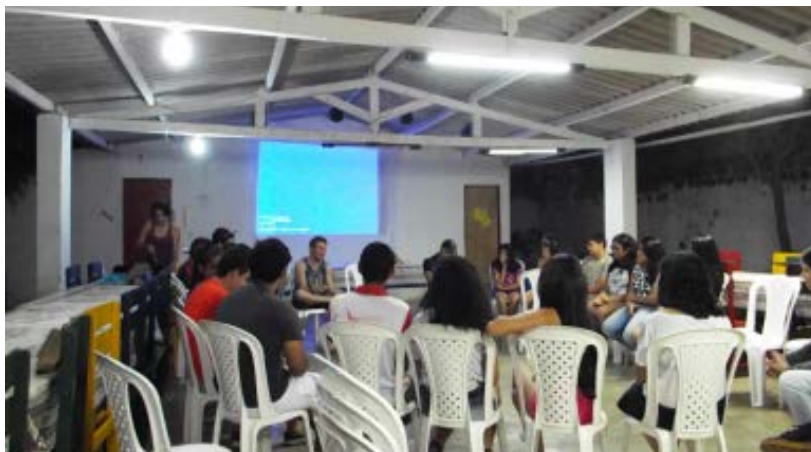
Foto 2 - Debate realizado após exibição do filme