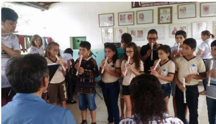
Foto 10 - Apresentação do Grupo de Flauta Doce Professora Lourdes Medeiros no Centro de Capacitação Agrocomunitário