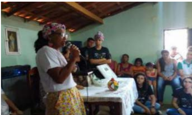
Foto 19 - Intercâmbio entre turmas do IFPB e comunidades quilombolas da região. Comunidade Quilombola Gia