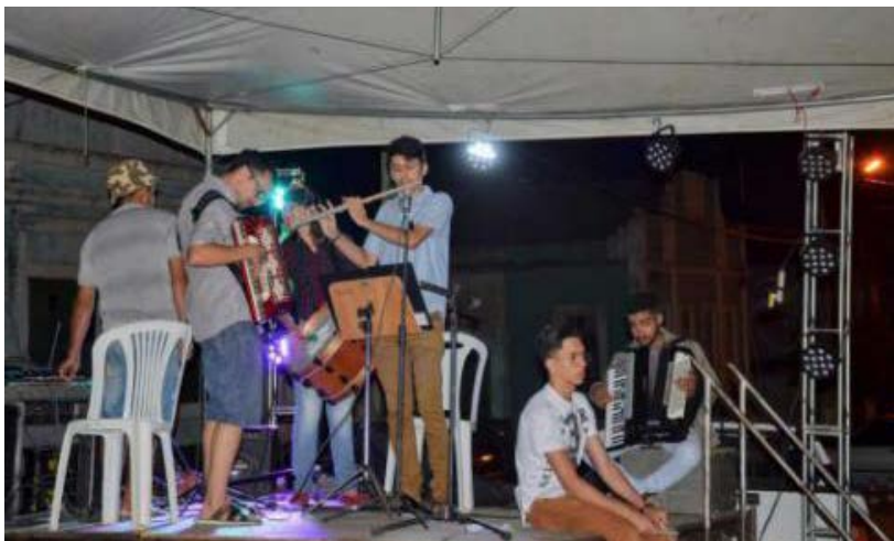
Foto 9 - Apresentação de monitores das oficinas no São João Bazar