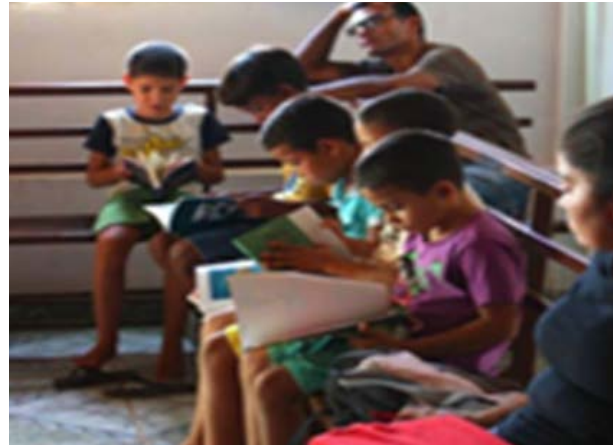
Foto 2 - Rodas de leitura