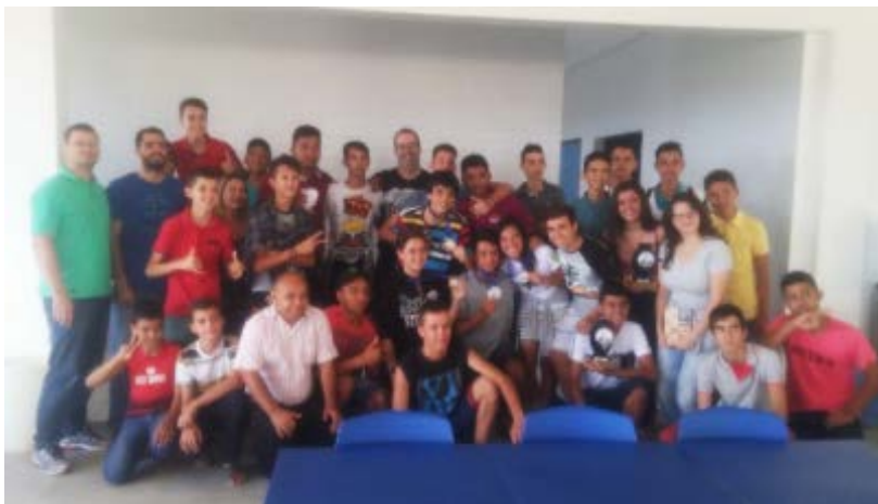
Foto 4 - Equipe e estudantes do projeto