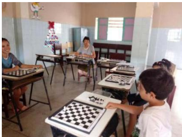
Foto 6- Oficinas de Xadrez