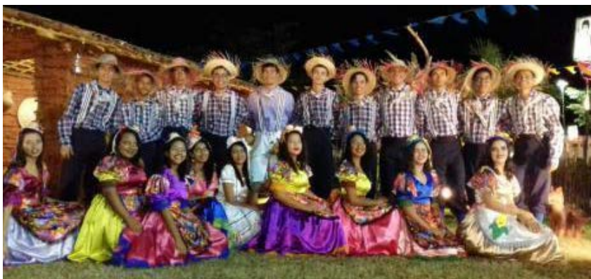
Foto 2 - Apresentação de estudantes com o Grupo de Cultura Abolição durante o São João da cidade de Princesa Isabel