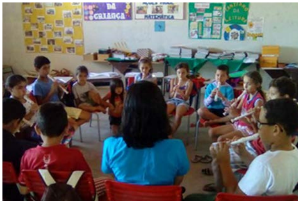
Foto 1 - Oficinas de Flauta Doce na EMEF Acadêmico Severiano Diniz na Lagoa de São João -PB

Para que o projeto ganhasse fôlego um dos eixos de atuação foi a formação de monitores, estudantes do IFPB e moradores da comunidade, para atuarem como agentes disseminadores da educação musical. Outro eixo do projeto foi a formação iniciada em educação musical para educadores das escolas públicas de Princesa Isabel e região, assim como a elaboração de material didático para ser utilizado pelos monitores e educadores nas oficinas de música que aconteciam semanalmente.