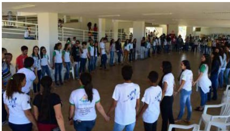
Foto 21 - Ciranda da Inclusão, com música criada por estudantes do IFPB

Semana da Inclusão (2019) - Criando espaços de discussão para uma sociedade acolhedora.