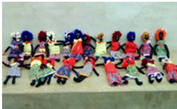
Foto 2 - Oficina Confeção de Bonecas e Bonecos de Pano na Comunidade Quilombola Cavalhada/PE, 2017