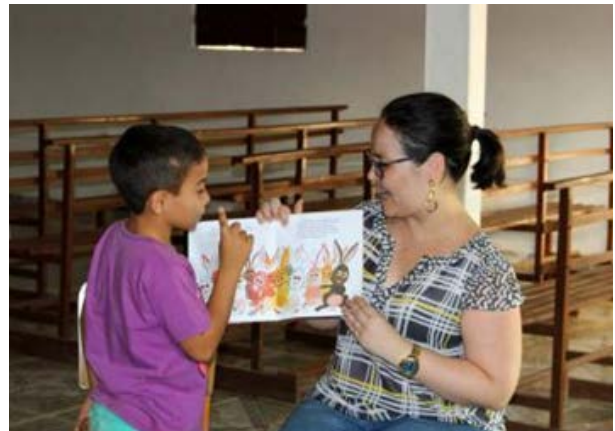
Foto 4 - Momento de leitura