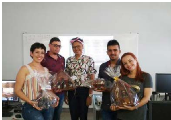
Foto 2 - Entrega de site do Artesanato Salomão