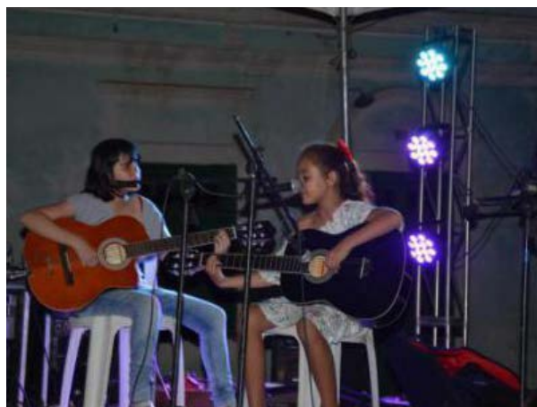
Foto 8 - Apresentação de crianças participantes das oficinas no São João Bazar