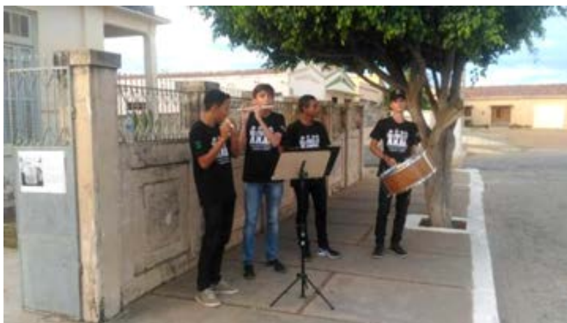
Fotos 24 e 35- Apresentação de trio de pífanos (Grupo Forró para Todos)