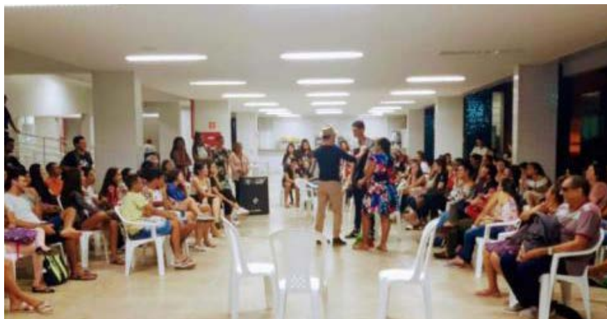
Foto 4 - Apresentação da Peça Conflitos em Desejos (Oficina de Teatro do Oprimido em 2020)