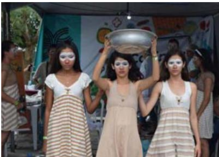
Foto 4 - Apresentação da Peça A Água Acabou (ENEX 2019)