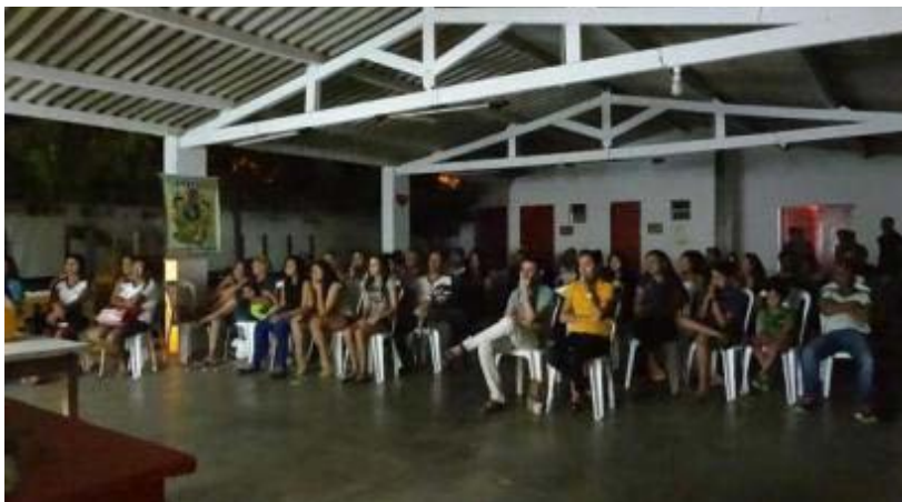
Foto 1 - Exibição de filme no Espaço Nordeste, em Princesa Isabel -PB

maneira crítica, temas e situações da sociedade contemporânea sob uma perspectiva interdisciplinar. Além disso, também conseguiu de maneira exitosa promover uma maior aproximação entre o IFPB e a comunidade de maneira geral.