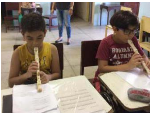
Foto 5 - Oficinas de flauta doce.