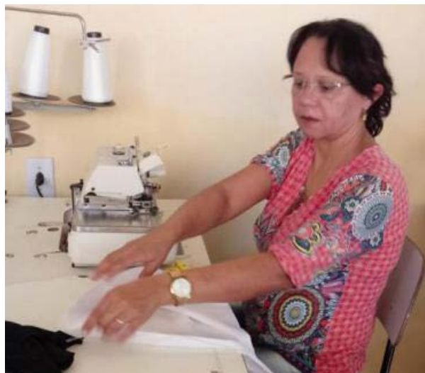
Foto 12 - Aprendiz do Curso de Corte e Costura