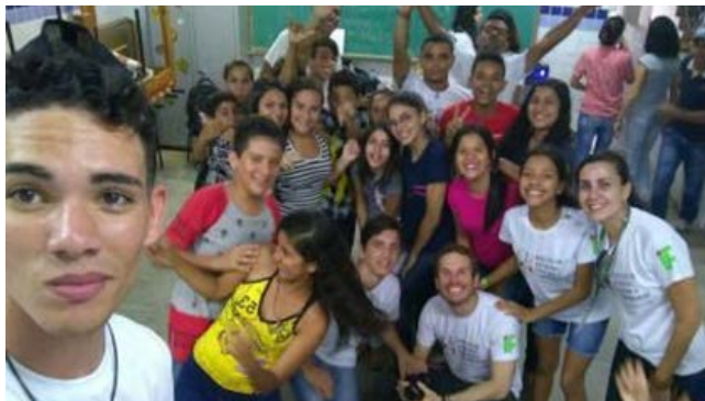
Foto 1 - Participação de equipe do projeto no ENEC 2017