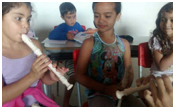
Foto 4 - Oficina de Flauta Doce na Lagoa de São João, 2016