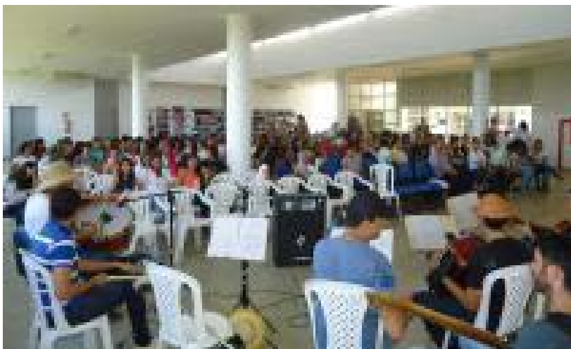
Foto 4 - Dó-sentes participando do Simpósio da Caatinga em Princesa Isabel