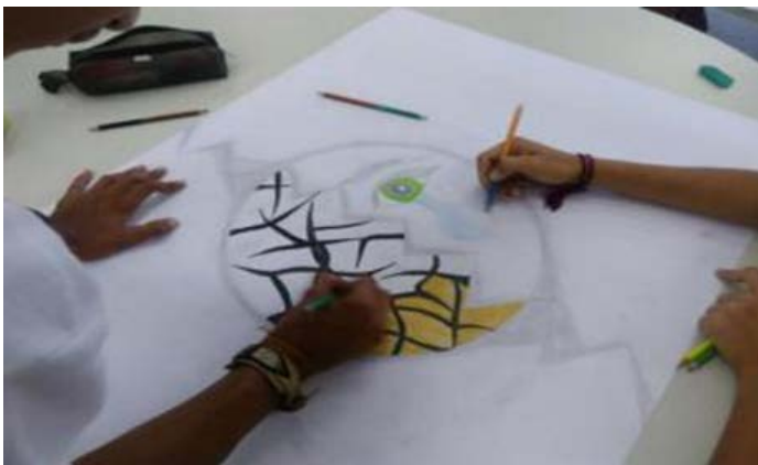
Foto 1 - Oficina de desenhos

metodologia interdisciplinar utilizada para aprendizado dos conteúdos e realizados relatos dos estudantes participantes do programa para professores de outras instituições de ensino, assim como dialogadas as possibilidades de aplicação da metodologia em outras escolas.