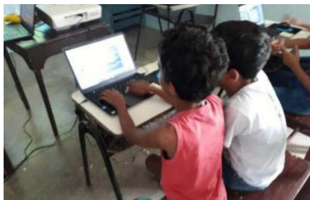
Foto 4 - Oficinas de informática