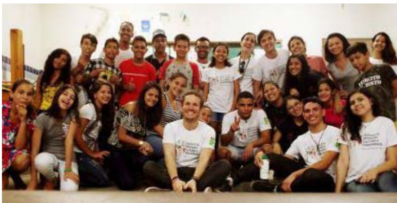
Foto 4 - Participação da equipe do Cineclub IFPB, no ENEX 2017