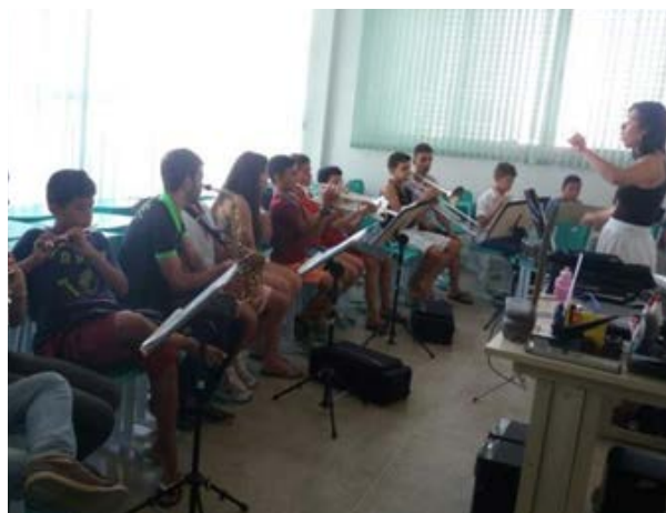
Foto 5 - Oficinas de Prática de Conjunto Lagoa de São João EEEFN Gama e Melo, IFPB - Princesa Isabel