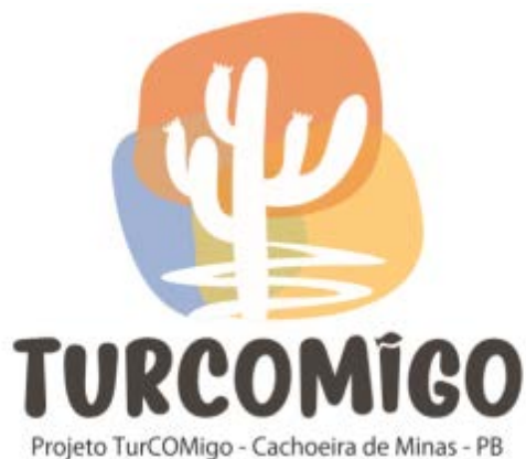
Identidade visual criada para o projeto

tidade, fortalecendo esse potencial econômico da região, gerando renda e motivando, ainda mais, os laços comunitários, a autoestima e o protagonismo, já que essas são as principais potencialidades, mesmo que eles não tenham, ainda, se apoderado disso.