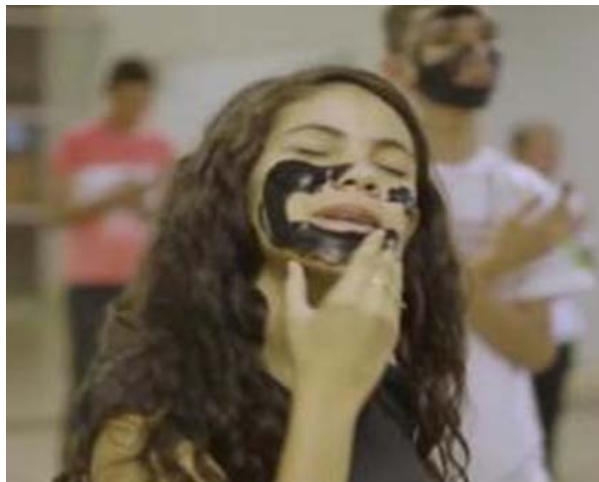
Foto 2 - Apresentação da Peça Identidades Brasileira/Documentário Tecno Pop da TV Escola em 2018