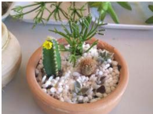
Foto 1 - Oficina “Terrários Ornamentais” incentivo à preparação de produtos para venda turística