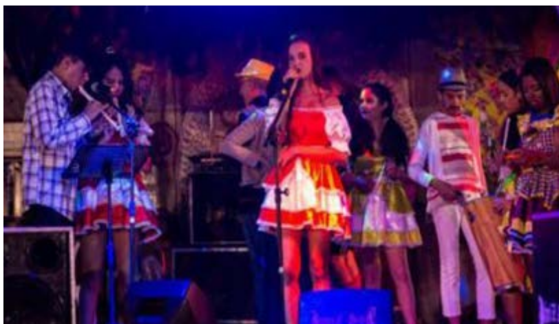
Fotos 11 e 12- Apresentação de quadrilhas e grupos musicais de estudantes (São João 2017)