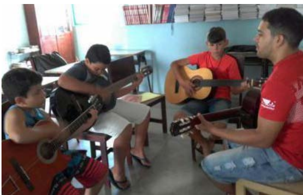
Foto 3 - Oficinas de violão.