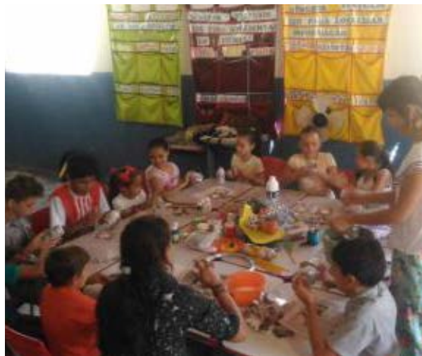
Foto 3 - Oficina de reutilização de materiais para crianças, na qual os participantes criaram seus próprios brinquedos