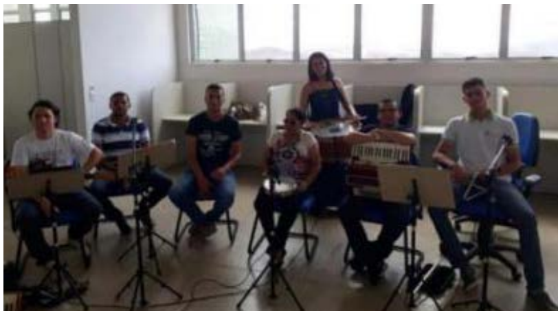
Foto 16 - Apresentação musical, participantes do Neccom e do Grupo Dó-sentes

Jornadas de Educação Ciência e Tecnologia do Campus Princesa Isabel (2016, 2017, 2018) - Mostra de trabalhos científicos e de extensão do IFPB para aproximar comunidade e escola.