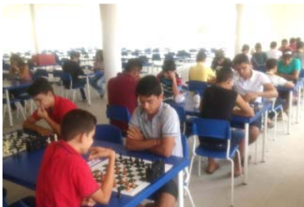
Foto 1 - Torneio de Xadrez no IFPB Campus - Princesa Isabel

O projeto também promoveu Torneios de Xadrez no IFPB Campus Princesa Isabel que reuniu os estudantes da Escola fundamental, técnicos, professores do IFPB. E organizou a Sala de Xadrez Antônio Cláudio França Pessoa na biblioteca do IFPB Campus Princesa Isabel.