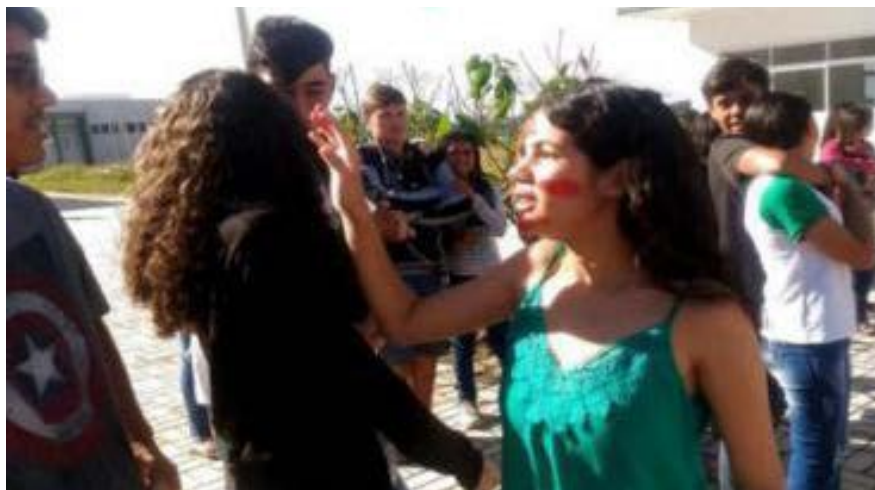
Fotos 7 e 8 - Teatro do Oprimido para reflexão sobre as condições sócio-históricas dos povos indígenas brasileiros