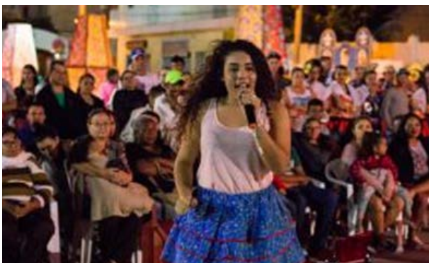
Foto 3 - Apresentação da Peça Contando e Cantando a Vida de Gonzagão, São João 2017