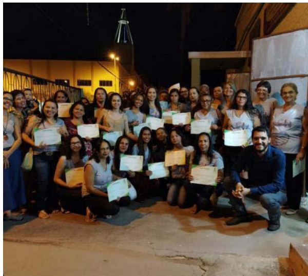
Foto 14 - Certificação das 40 mulheres participantes do Curso de Corte e Costura