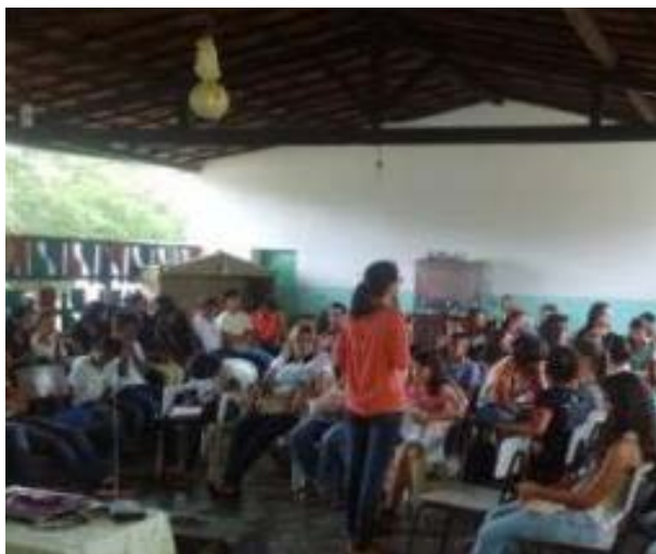
Foto 2 - Visita e reunião no CCA