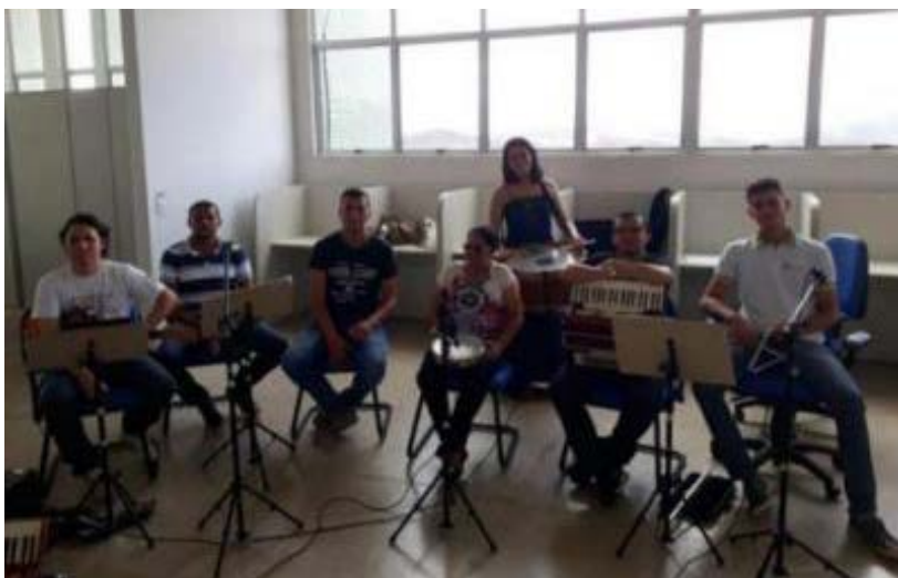
Foto 3 - Participação do grupo em Jornada Científica do campus Princesa Isabel