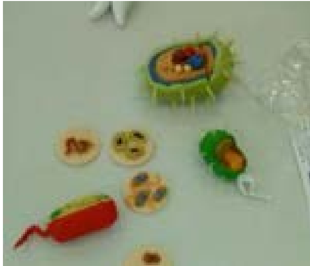
Foto 3 - Alguns modelos construídos na oficina de biscuit