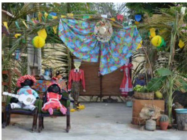
Foto 7 - São João Bazar em prol da Oficina Madre Carmelita

O Bazar de São João do Educandário iria realizar sua terceira versão, em 2020, mas devido ao cancelamento das atividades, por conta da Pandemia do Covid-19, não aconteceu.