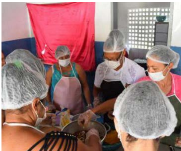
Foto 2 - Oficina Café da Manhã Nutritivo incentivo à preparação de alimentações voltadas para o turismo