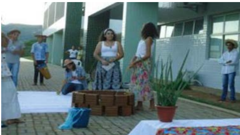
Foto 6 - Apresentação da Peça A Água Acabou pelo grupo Por trás dos Holofotes