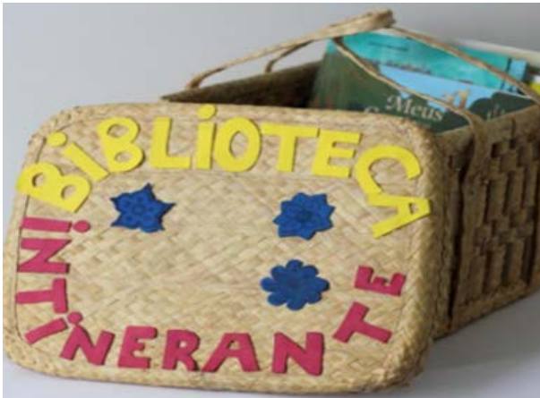
Foto 1 - Cesta da Biblioteca Itinerante