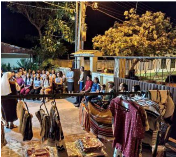
Foto 13 - Encerramento das atividades do Curso de Corte e Costura em 2019 com venda de produtos produzidos pelas mulheres durante o curso