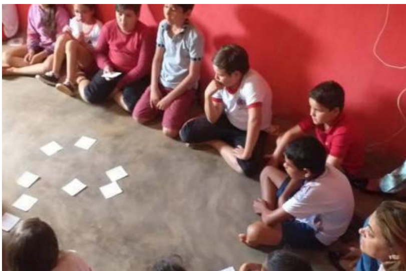
Foto 2 - Atividades de gamificação