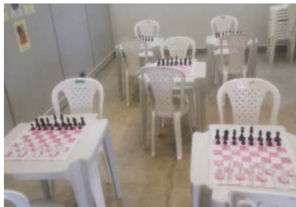
Foto 2 - Sala de Xadrez Antônio Cláudio França Pessoa