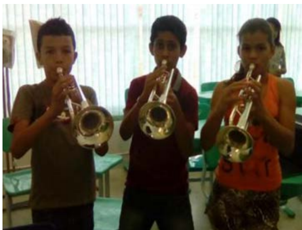
Foto 4 - Oficina de Instrumentos de Sopros Lagoa de São João e EEEFN Gama e Melo, no IFPB - Princesa Isabel