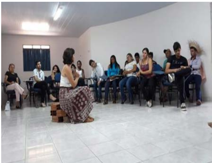
Foto 3 - Oficina de TO