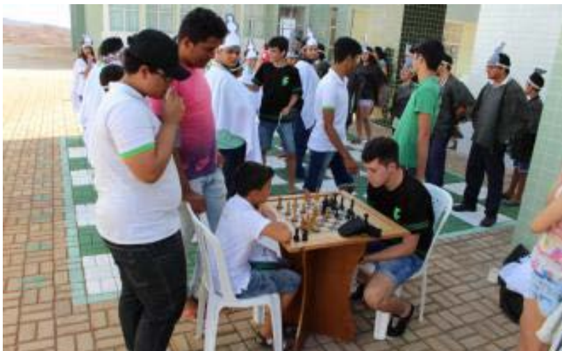
Foto 3 - Dia de intercâmbio entre projetos