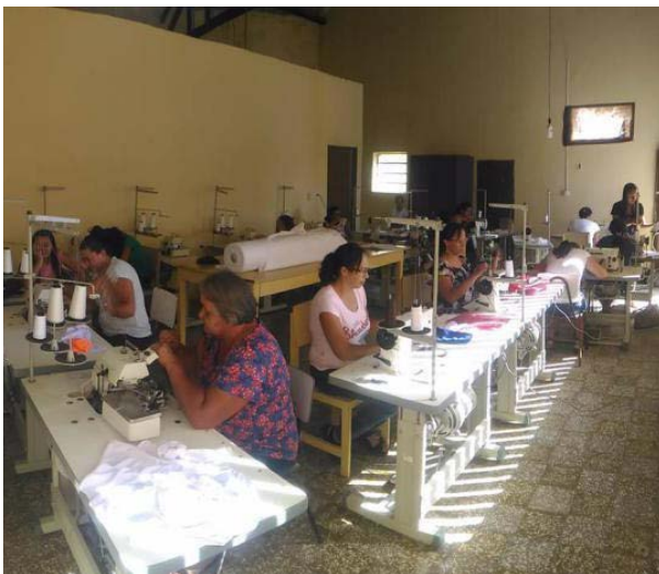
Foto 11 - Curso de Corte e Costura