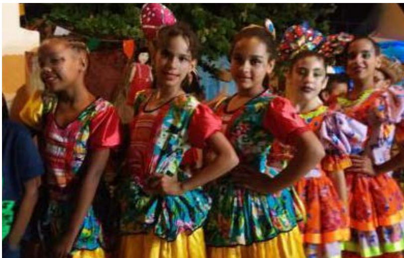
Foto 10 - Apresentação do Grupo de Dança Nova Geração durante o São João Bazar