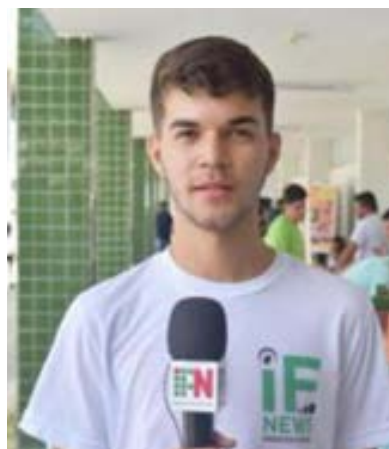
Foto 1, 2 e 3 - Estudantes participantes do projeto em cobertura de eventos, Jornadas Científicas e ENEX