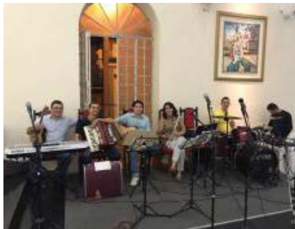
Foto 2 - Participação no dia do IFPB na Igreja Matriz de Princesa Isabel, em 2016