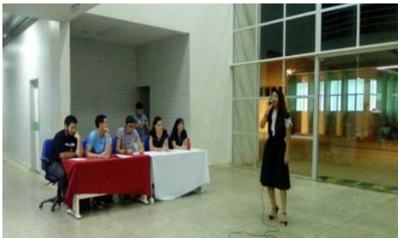
Fotos 22 e 23 - Apresentação de estudantes