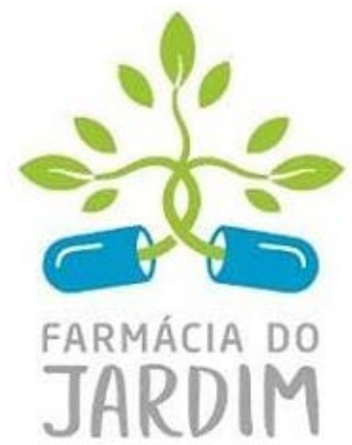
Identidade visual do projeto

O projeto culminou com a realização do curso de extensão “Vivência em cultivo e usos de plantas medicinais”, entre os dias 18 e 21 de dezembro de 2019. O curso teve duração de quatro dias e atividades realizadas em Cabedelo (PB), Lucena (PB) e Alhandra (PB).