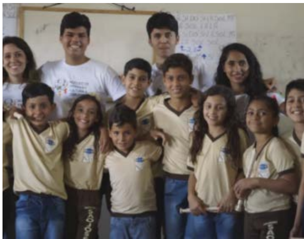
Foto 8 - Gravação de momentos das atividades com os monitores e crianças da Lagoa de São João