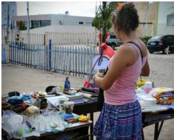
Fotos 13 - Bazar solidário

São João Bazar da Oficina Madre Carmelita - Educandário São José (2018 e 2019) - Brechó solidário para fortalecimento da Oficina Madre Carmelita.