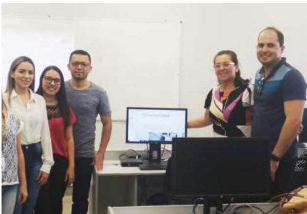
Foto 1 - Entrega de site para a Pousada Cajá