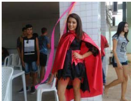
Fotos 1 e 2 - Estudantes fantasiadas