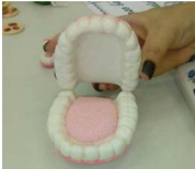
Foto 4 - Modelo construído na oficina de biscuit