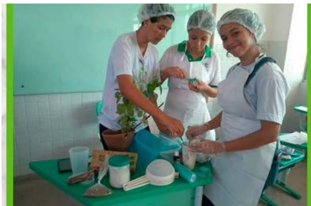
Foto 1 - Oficina de Remédios Caseiros