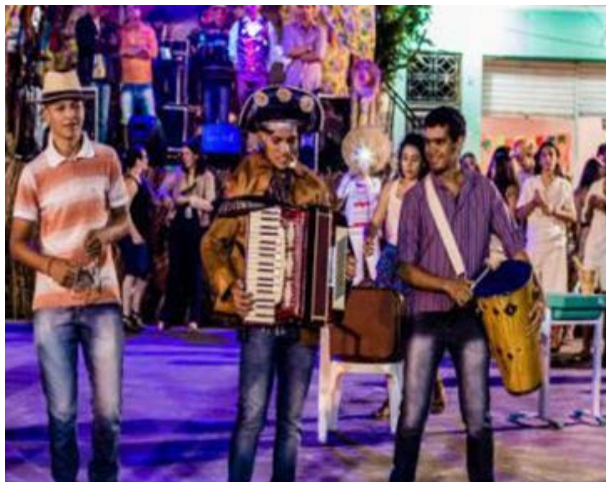
Foto 1 - Apresentação da Peça Cantando e Contando a Vida de Gonzagão, São João - 2017

Ao longo de quatro anos o grupo Por trás dos Holofotes se apresentou diversas vezes no IFPB, campus Princesa Isabel, em eventos como Jornadas, Semanas do Meio Ambiente, Simpósios da Caatinga, Dia da Mulher, Dia do Índio, Dia da Consciência Negra, semana de recepção e acolhimento de estudantes, eventos de Natal e São João do campus. Participou também de eventos da cidade de Princesa Isabel, como o Dia Nacional de Combate ao Abuso e Exploração Sexual de Crianças e Adolescentes - 18 de maio, o São João Bazar em prol da Oficina Madre Carmelita, Dia da Consciência Negra, inclusive em comunidades quilombolas de Princesa Isabel, e São João da cidade de Princesa Isabel, assim como da IV Semana Cultural de Manaíra, em 2016, e do Encontro de Extensão do IFPB, em Campina Grande, em 2019. E teve suas atividades financiadas, no ano de 2017, pelo edital PROBEXC PROJETO 01/2017. Nos demais anos o projeto ocorreu de forma voluntária.