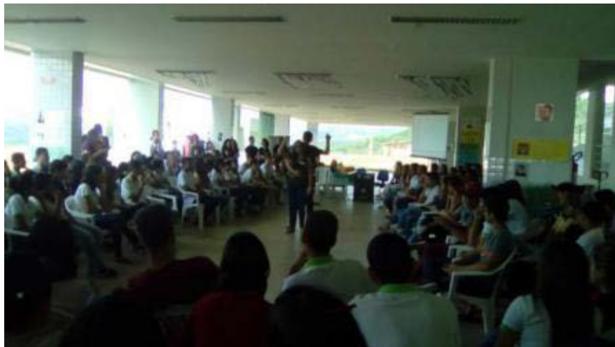
Foto 3 - Apresentação da Peça Violência Contra Mulher pelo grupo Por trás dos Holofotes

Dia Internacional da Mulher (2016, 2017, 2018 e 2020) - Discutindo gênero para a redução de desigualdades.