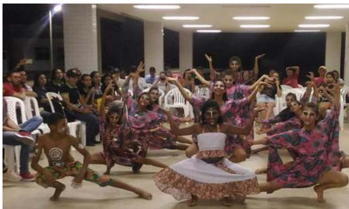
Foto 4 - Apresentação do Grupo de Dança Nova Geração no IFPB, Campus - Princesa Isabel, durante dia da Consciência Negra em 2017