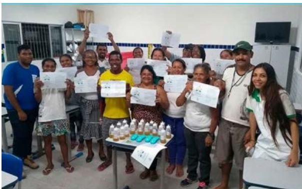
Foto 2 - Oficina na Escola São Judas Tadeu