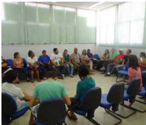
Foto 3 - Reunião e oficina no IFPB