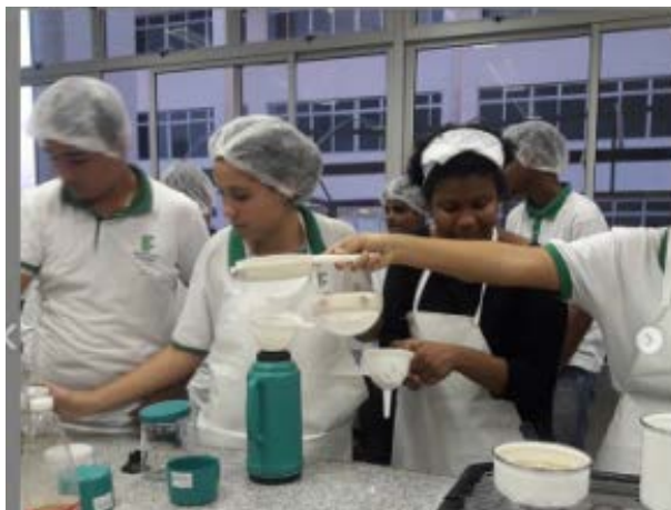
Foto 4 - Oficina Boas Práticas no Preparo de Remédios Caseiros