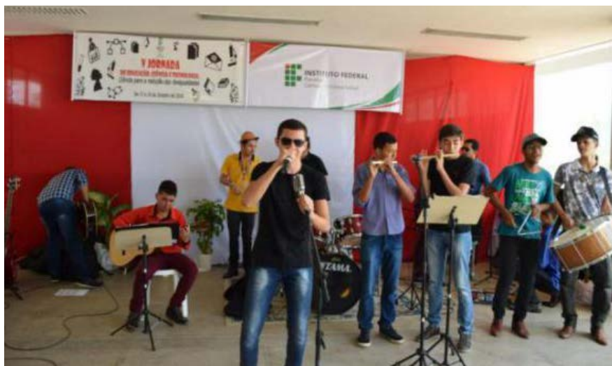
Foto 11 - Apresentação do Grupo Forró para Todos na V Jornada de Educação, Ciência e Tecnologia do IFPB - Princesa Isabel