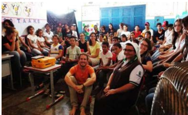
Foto 1 - Exibição de um filme pelo projeto Cineclube, 2017

projetos de braços abertos e com entusiasmo crescente. E, por isso, merecem toda a nossa reverência e reconhecimento, são eles: ONG Educandário São José, ONG Centro de Capacitação Agrocomunitário; Associações de moradores das comunidades: Cachoeira de Minas, Macambira, Carneiro de Medeiros, Riacho da Cachoeira, Lagoa de São João; Comunidades quilombolas: Livramento, Gia, Cavalhada; Escola Municipal de Ensino Fundamental Acadêmico Severiano Diniz, Emater-Princesa Isabel, Sebrae-Patos, Secretaria de Cultura da Prefeitura de Princesa Isabel – PB, Grupo de Dança Nova Geração, Grupo de Dança Abolição, Grupo de Capoeira Cordão e Ouro e o Grupo de Teatro SoundClash. Além de ações nos municípios de Juru, Tavares e São José de Princesa, vizinhos a Princesa Isabel.