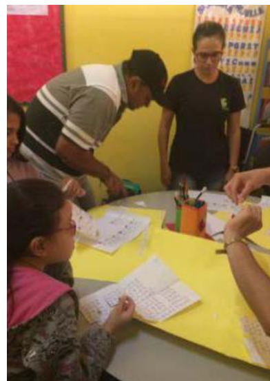
Foto 3 - Coordenadora do projeto realizando atividades com os alunos