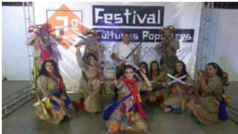
Foto 20- Apresentação do Grupo de Cultura Abolição, apoiado pelo Nec- com através do projeto Dançando com Cidadania

Festival Culturas Populares - Edição Princesa Isabel (2019) - fortalecendo grupos culturais locais.