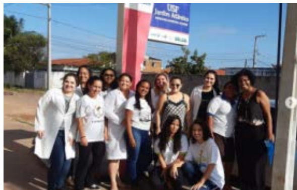
Foto 3 - Socialização da estratégia metodológica do projeto na UBS - Jardim Atlântico