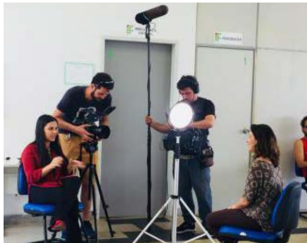
Foto 9 - Coordenadora do projeto sendo entrevistada pela equipe da TV Escola