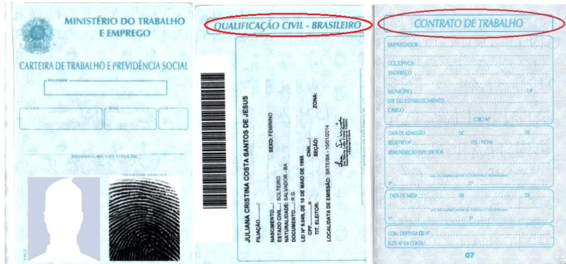
Figura 3: Página de identificação. Fonte: Google;