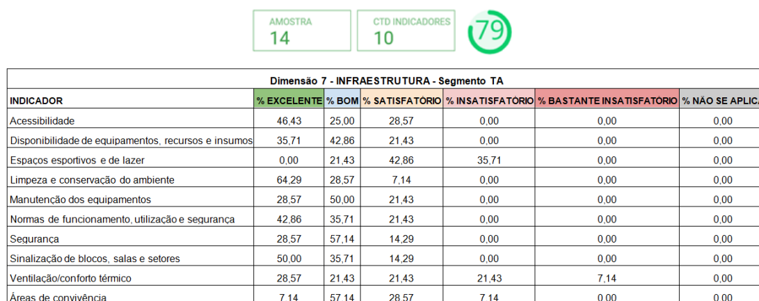
Figura 4.9 - Visão detalhada dos indicadores da Dimensão 7 - Infraestrutura para o segmento TA.

A dimensão Infraestrutura Física é avaliada pelos técnicos administrativos (20 respondentes) com base em 10 indicadores : acessibilidade; disponibilidade de equipamentos, recursos e insumos; espaços esportivo e de lazer; limpeza e conservação do ambiente; manutenção dos equipamentos; normas de funcionamento, utilização e segurança; segurança; sinalização de blocos, salas e setores; ventilação/conforto térmico; áreas de convivência. Os resultados obtidos através do questionário eletrônico para o segmento técnico administrativo, na dimensão 7 do eixo 5, estão exibidos na Figura 4.9.