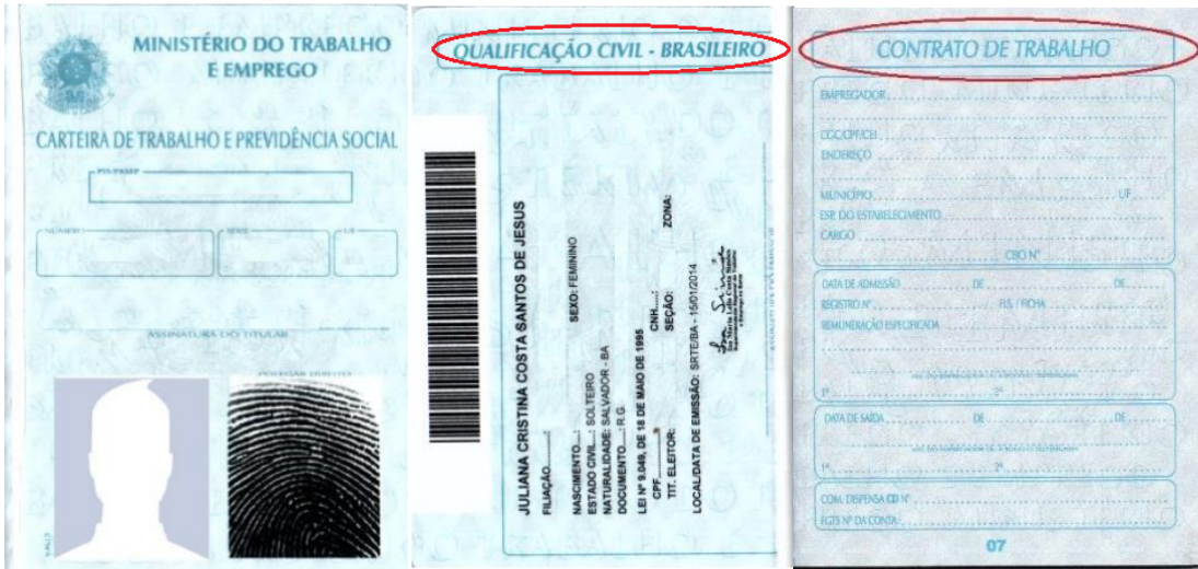
Figura 3: Página de identificação.