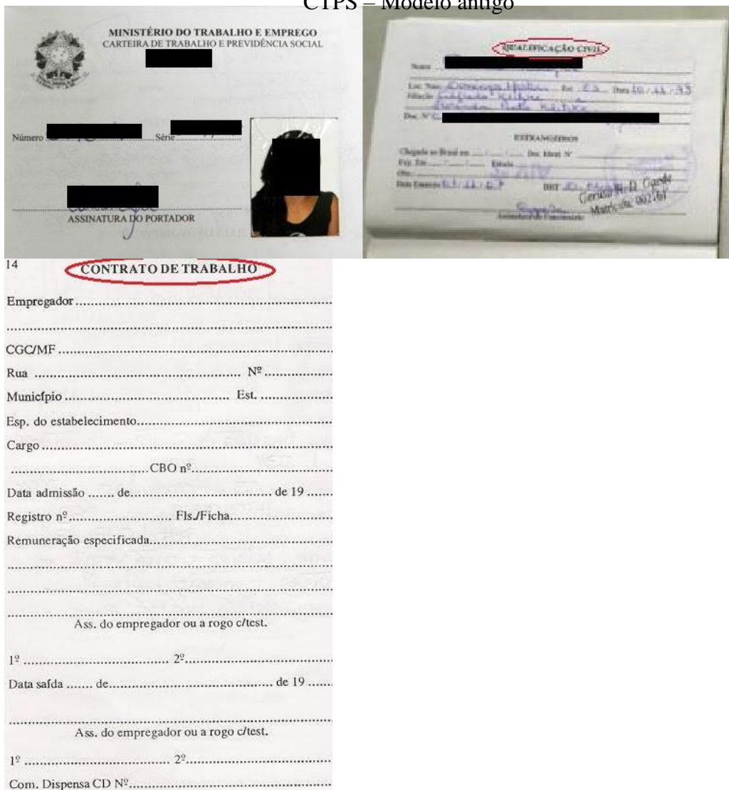
Figura 1: Página de identificação.