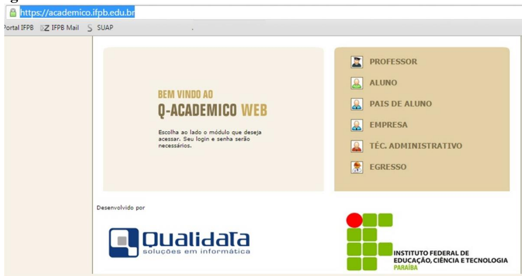
Figura 2 – Tela de acesso ao Sistema de Controle Acadêmico

Para acessar os sistemas, digite o endereço na “barra de endereços” do seu navegador na internet https://academico.ifpb.edu.br/ (Para Acadêmico 2.0 Web) e https://suap.ifpb.edu.br/accounts/login/?next=/ (Para SUAP). Feito isso, a tela inicial irá aparecer: