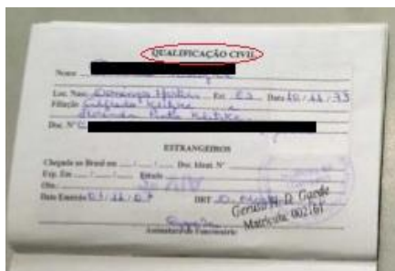
Figura 2: Página de qualificação civil.