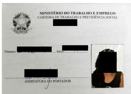
Figura 1: Página de identificação.