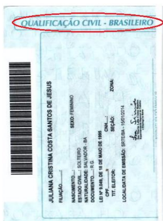
Figura 4: Página de qualificação civil.