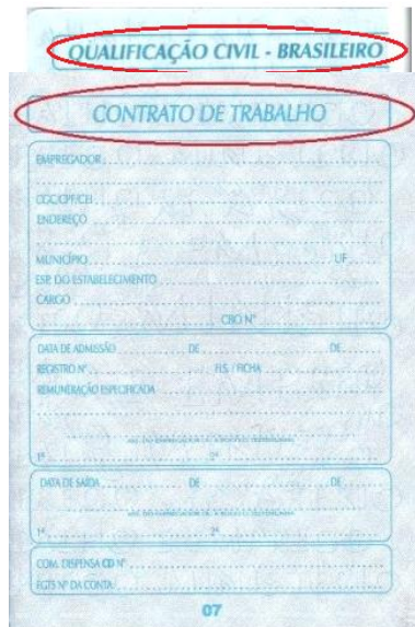
Figura 5: Página de qualificação civil.