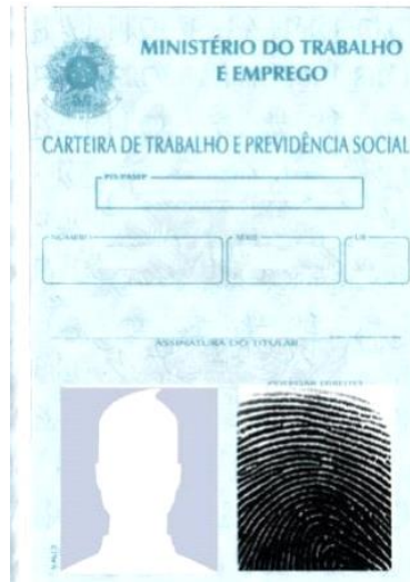
Figura 4: Página de identificação.