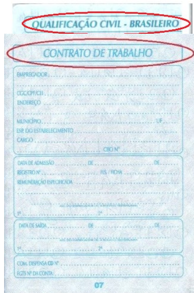
Figura 5: Página de qualificação civil.