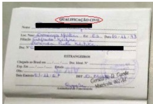
Figura 2: Página de qualificação civil.