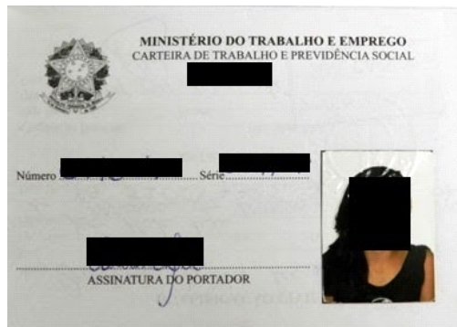
Figura 1: Página de identificação.