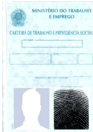
Figura 4: Página de identificação.