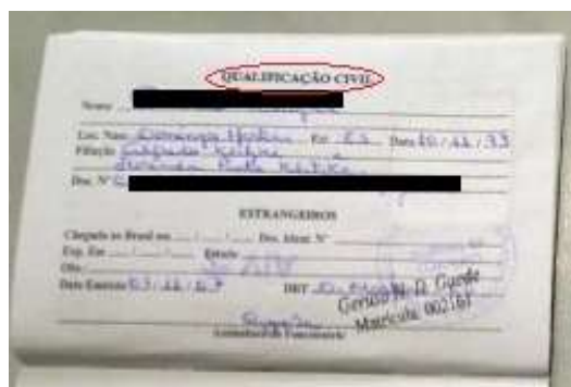
Figura 2: Página de qualificação civil.