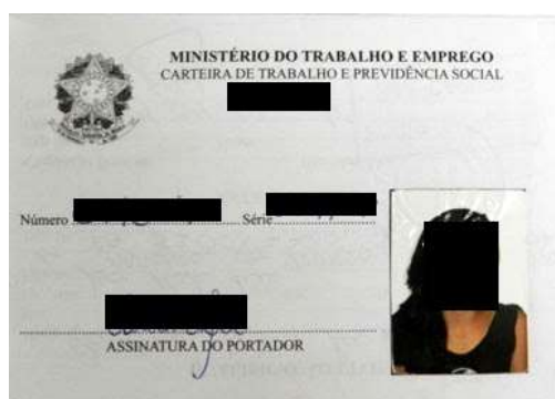
Figura 1: Página de identificação.