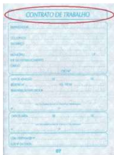
Figura 6: Página da seção de “contrato de trabalho”.