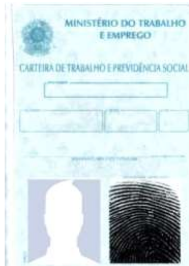
Figura 4: Página de identificação.