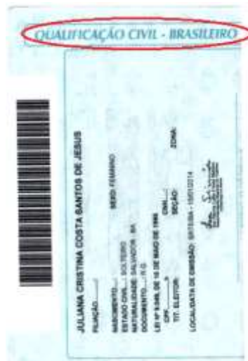
Figura 5: Página de qualificação civil.