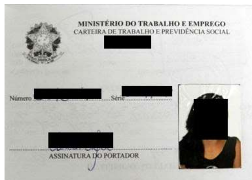
Figura 1: Página de identificação.