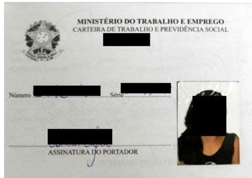
Figura 1: Página de identificação.