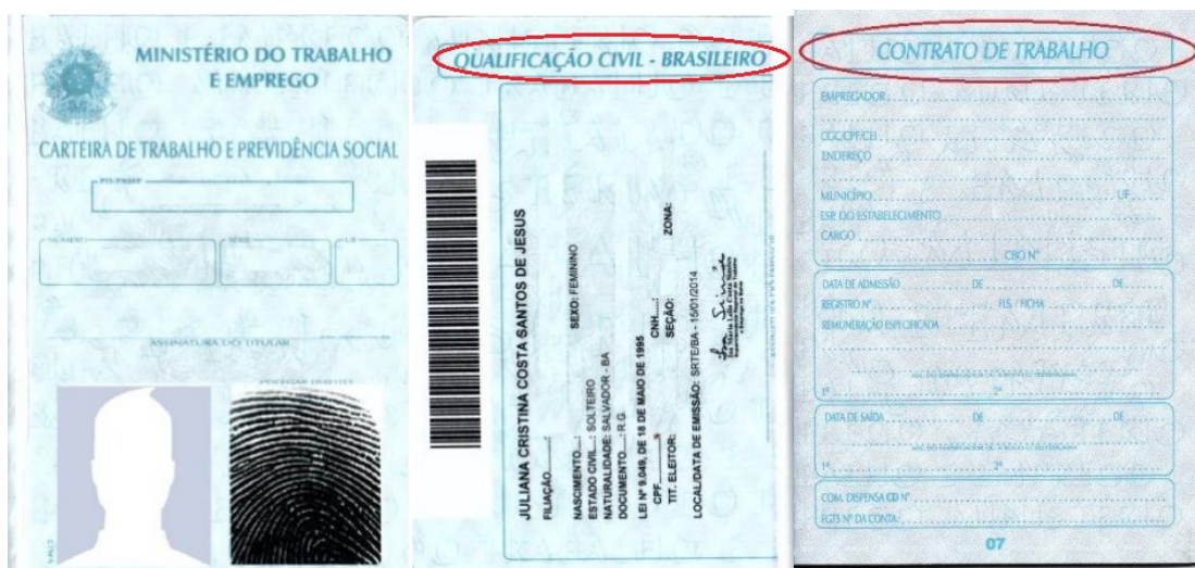
Figura 3: Página de identificação.