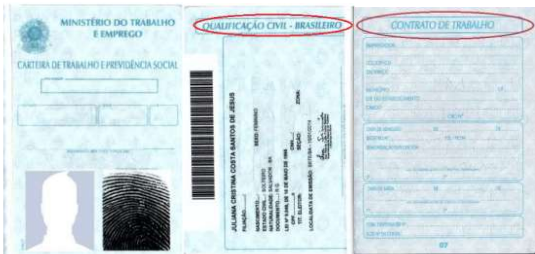
Figura 3: Página de identificação.