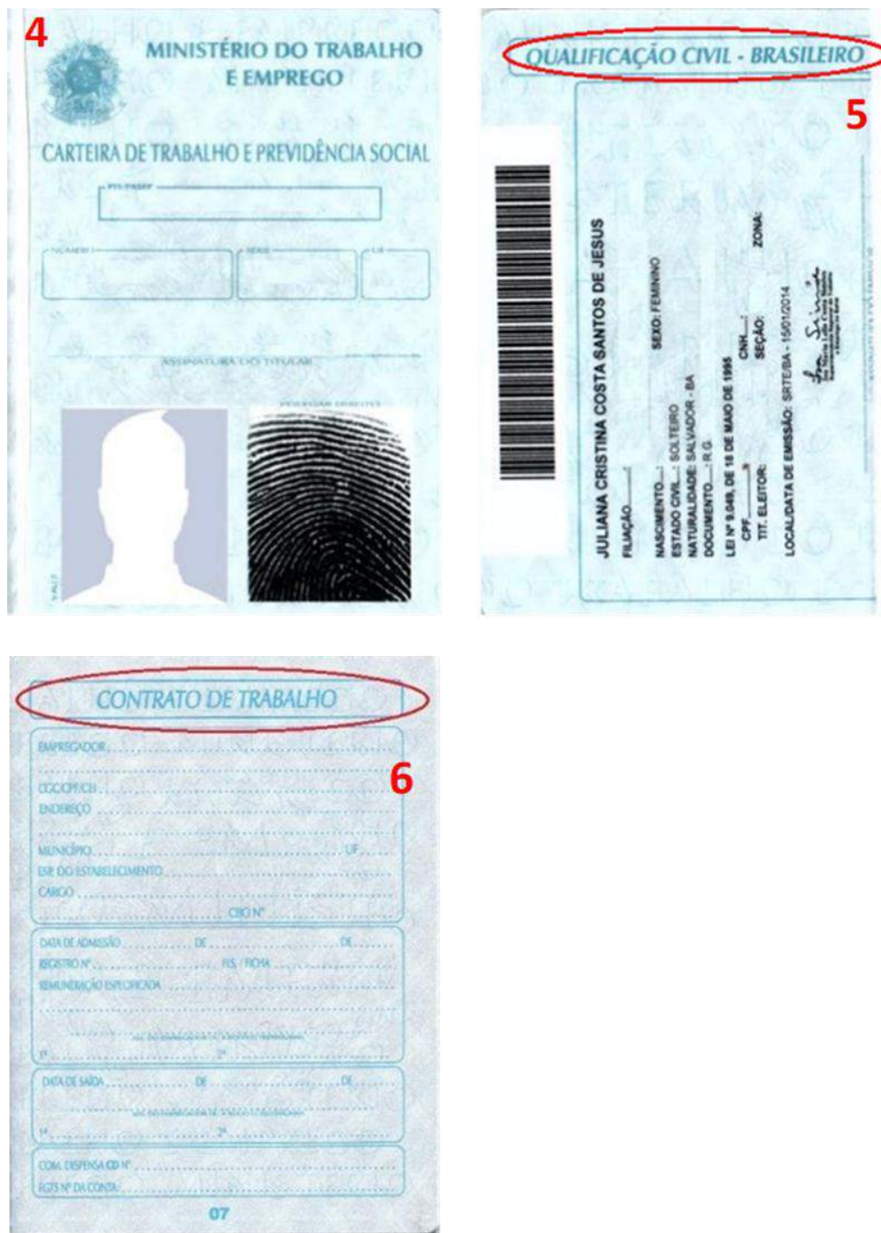
Figura 4: Página de identificação.