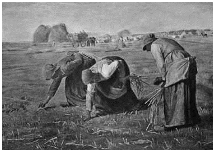
“The Gleaners”, obra de Jean Fran ois Millet (1857).

Em rela o aos elementos representados na obra art stica acima, pode-se constatar que o sistema de produ o reproduzido pode ser classificado como