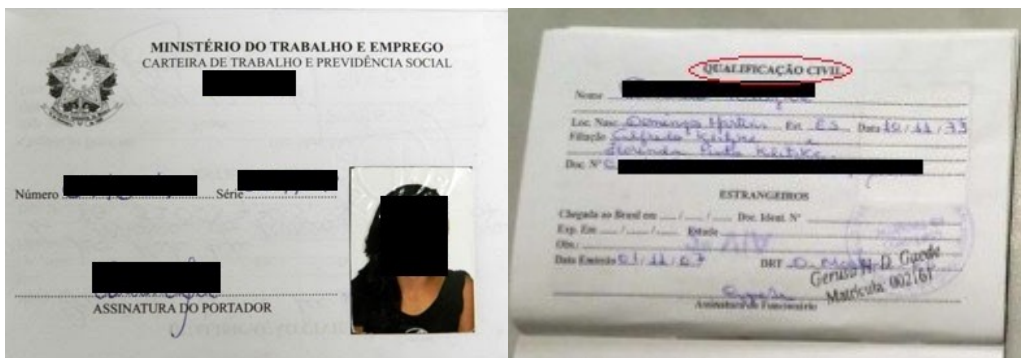
Figura 1: Página de identificação.