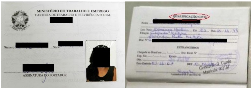
Figura 1: Página de identificação.