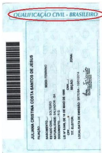
Figura 4: Página de qualificação civil.