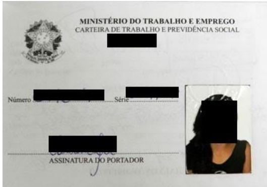
Figura 1: Página de identificação.