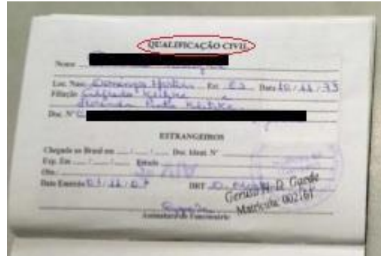
Figura 2: Página de qualificação civil.