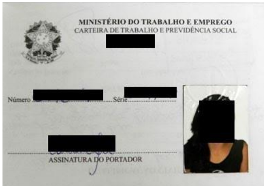
Figura 1: Página de identificação.