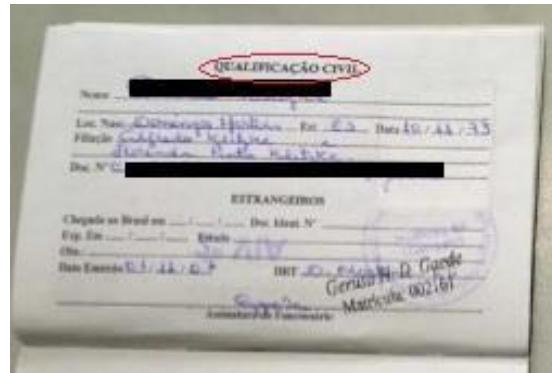
Figura 2: Página de qualificação civil.