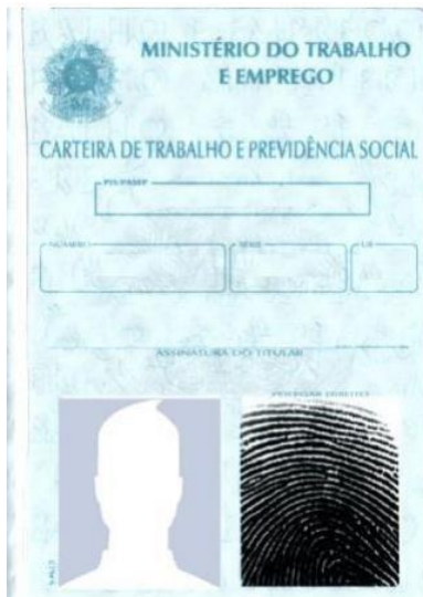
Figura 3: Página de identificação.