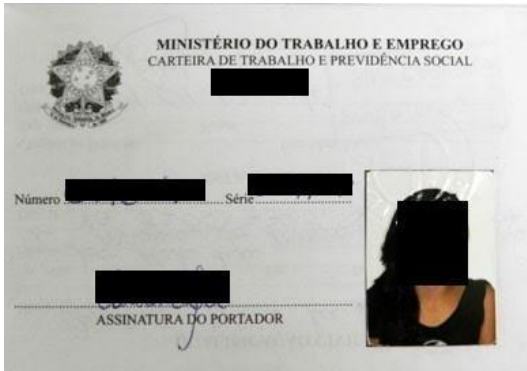
Figura 1: Página de identificação.