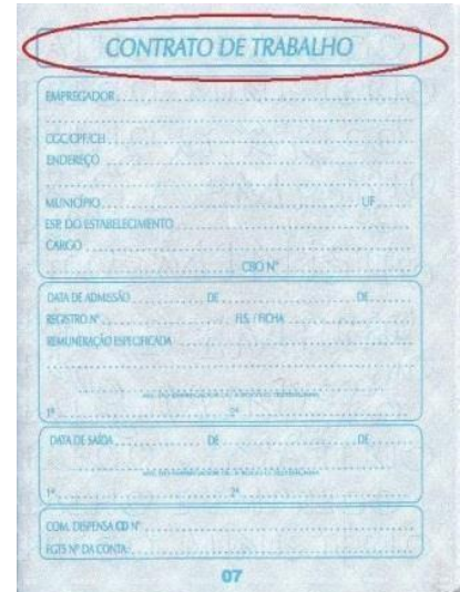
Figura 5: Página da seção de “contrato de trabalho”.