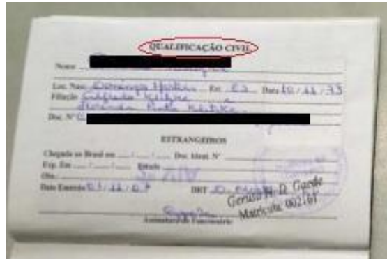
Figura 2: Página de qualificação civil.