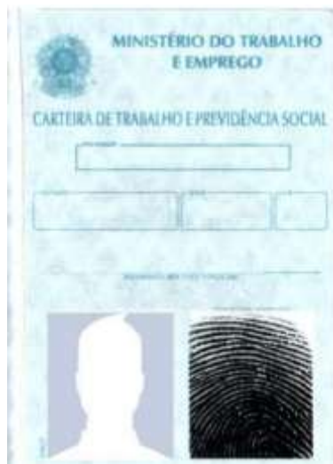
Figura 4: Página de identificação.