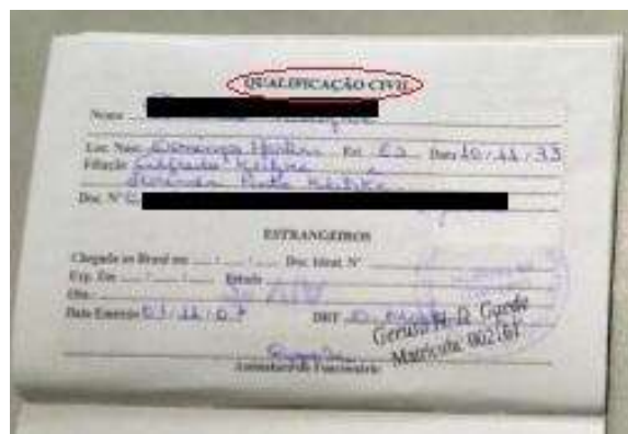
Figura 2: Página de qualificação civil.