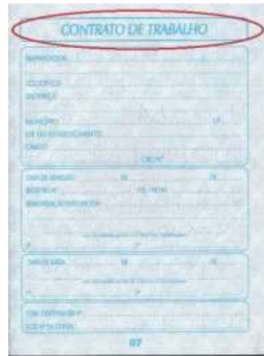
Figura 6: Página da seção de "contrato de trabalho".