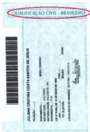
Figura 5: Página de qualificação civil.