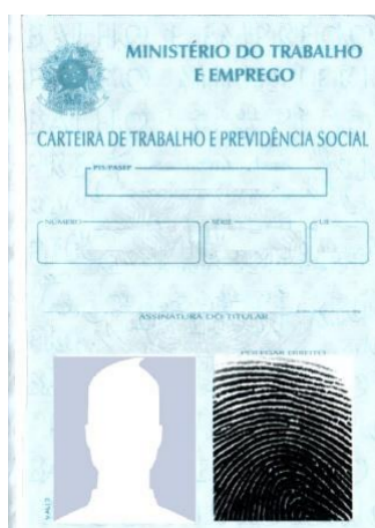
Figura 4: Página de identificação.