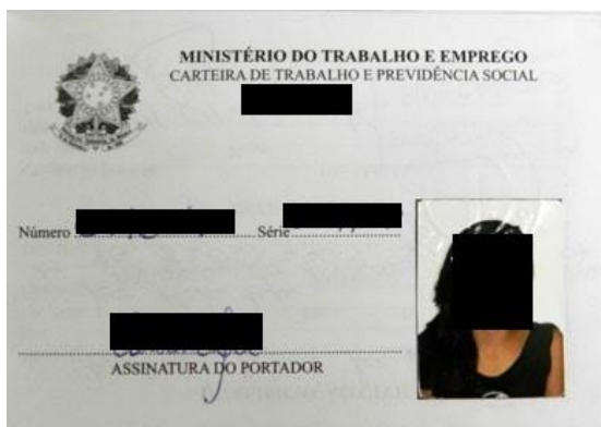
Figura 1: Página de identificação.