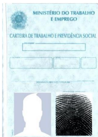
Figura 4: Página de identificação.