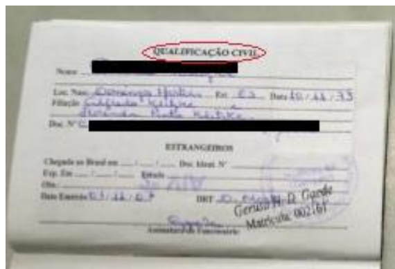
Figura 2: Página de qualificação civil.