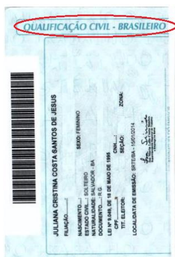
Figura 5: Página de qualificação civil.