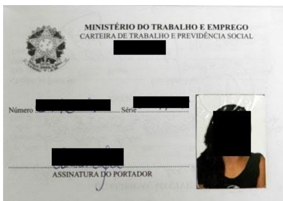
Figura 1: Página de identificação.