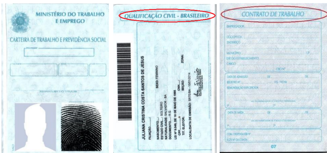
Figura 1: Página de identificação.