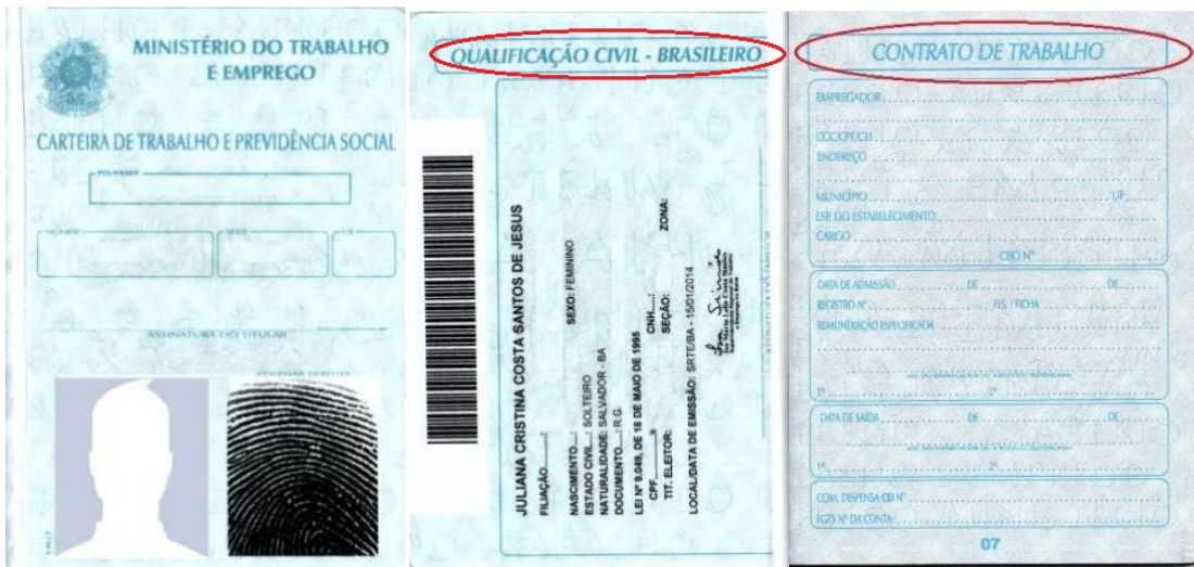
Figura 3: Página de identificação.